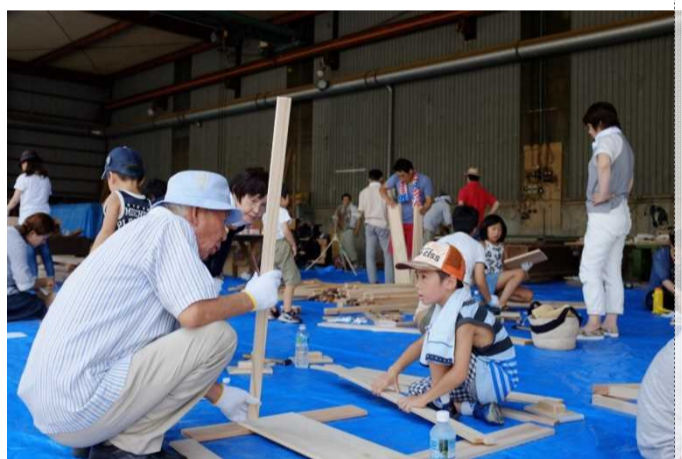
しそうの森の木の取り組み ■ 木材物流 ■ 発注