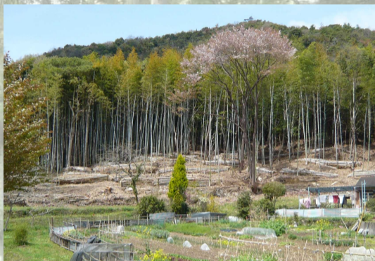
[ バッファゾーン整備 ]

農作物被害など野生動物と人との軋轢が生じている区域において、人と野生動物との棲み分けゾーン(バッファゾーン)の設置や広葉樹林を整備