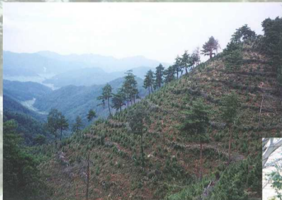
[ 下刈 ]