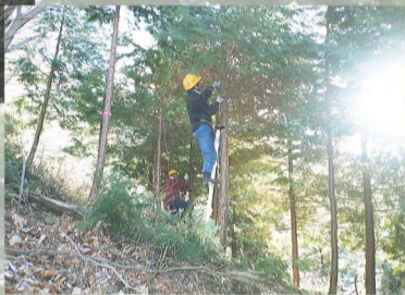
[ 枝打 ]

健全な生育を促すため、造林木の生長を阻害する雑草を刈払う「下刈」や、節のない良質材の生産のほか、病虫害の防止や林内を明るくするために枝を切り落とす「枝打」などの保育作業を実施