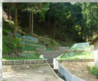
[ 簡易防災施設 ]