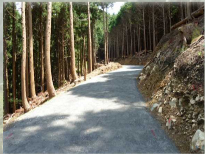
[ 作業道開設 ]