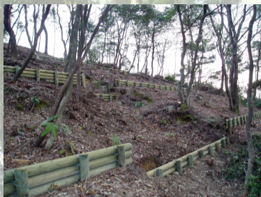
[ 森林整備 ]