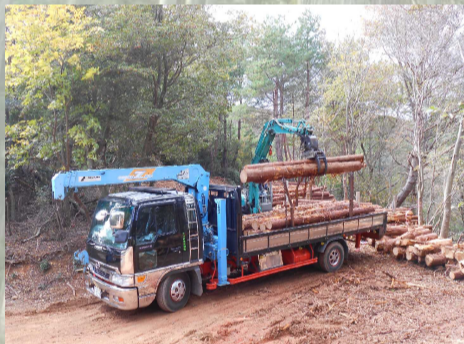
[ 搬出 ]