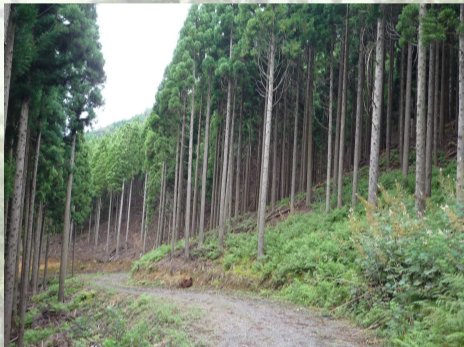
[ 間伐 ]