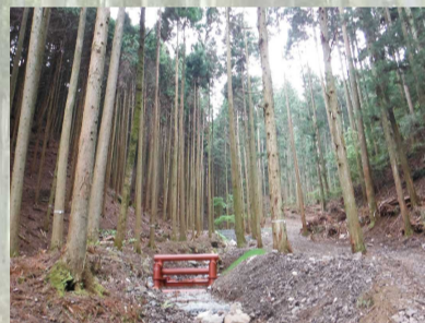
[ 災害緩衝林整備 ]

土石流や流木被害が発生する恐れのある危険溪流を対象に、危険木の除去や深根性広葉樹の植栽、簡易流木止め施設を整備