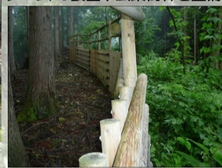
[ 植生保護柵 ]