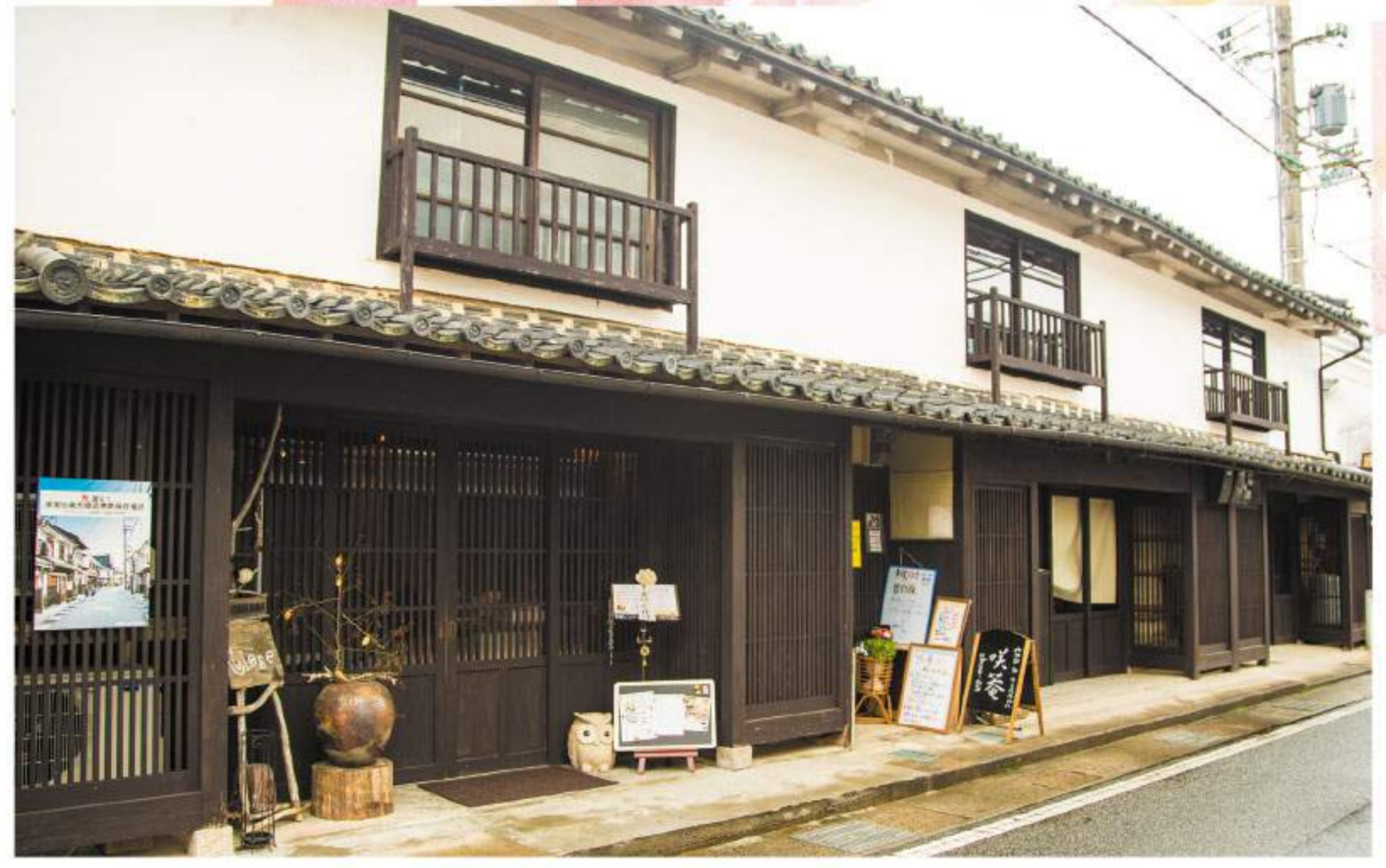
たつの市龍野町川原町151-1