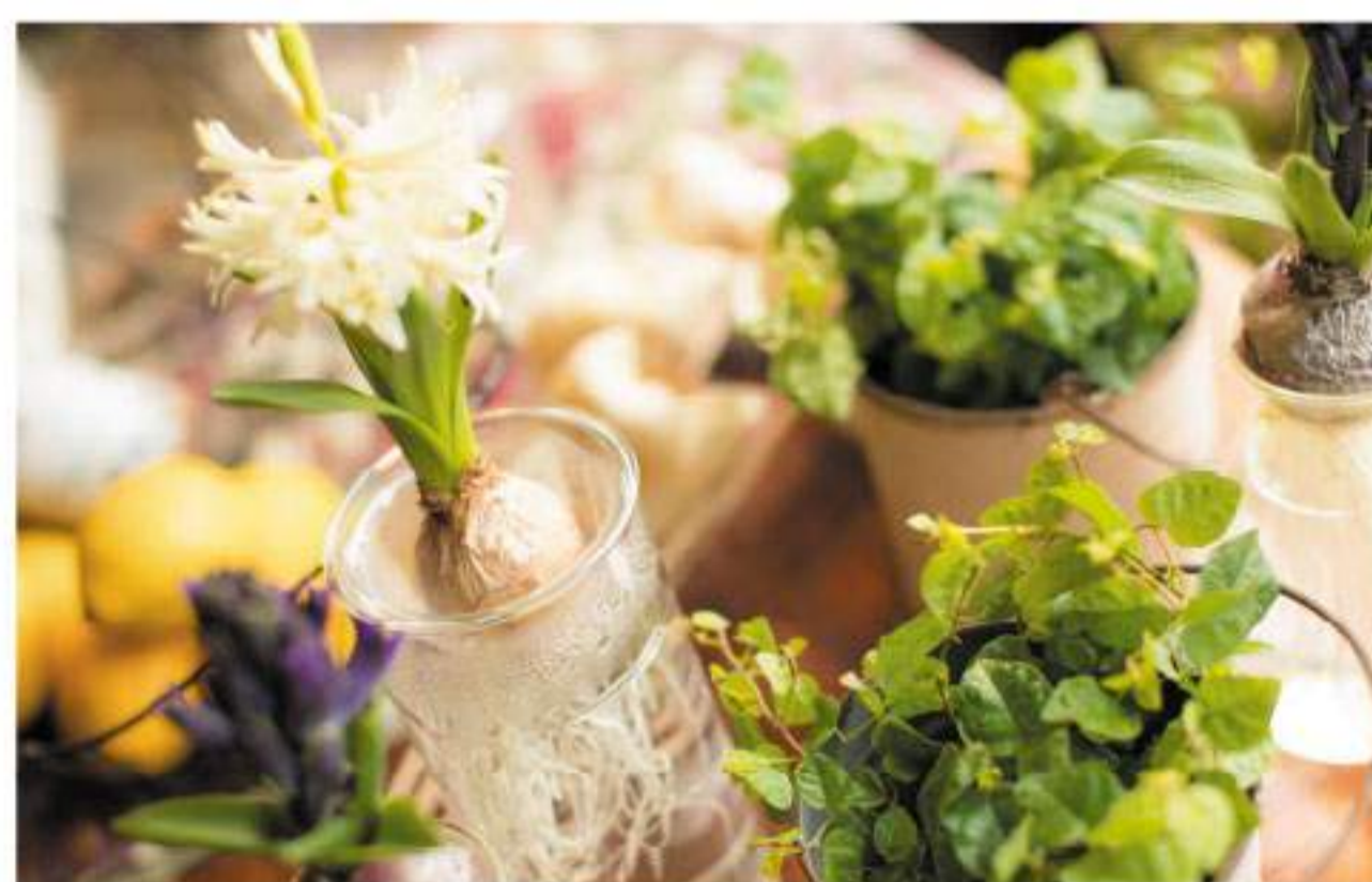
お洒落な雑貨や季節のグリーンも数多く揃え、訪れるたびに変わるディスプレイも楽しみのひとつです。

人々の心を動かすCallaの花は、今日も笑顔を咲かせ、優しさの輪を広げていきます。