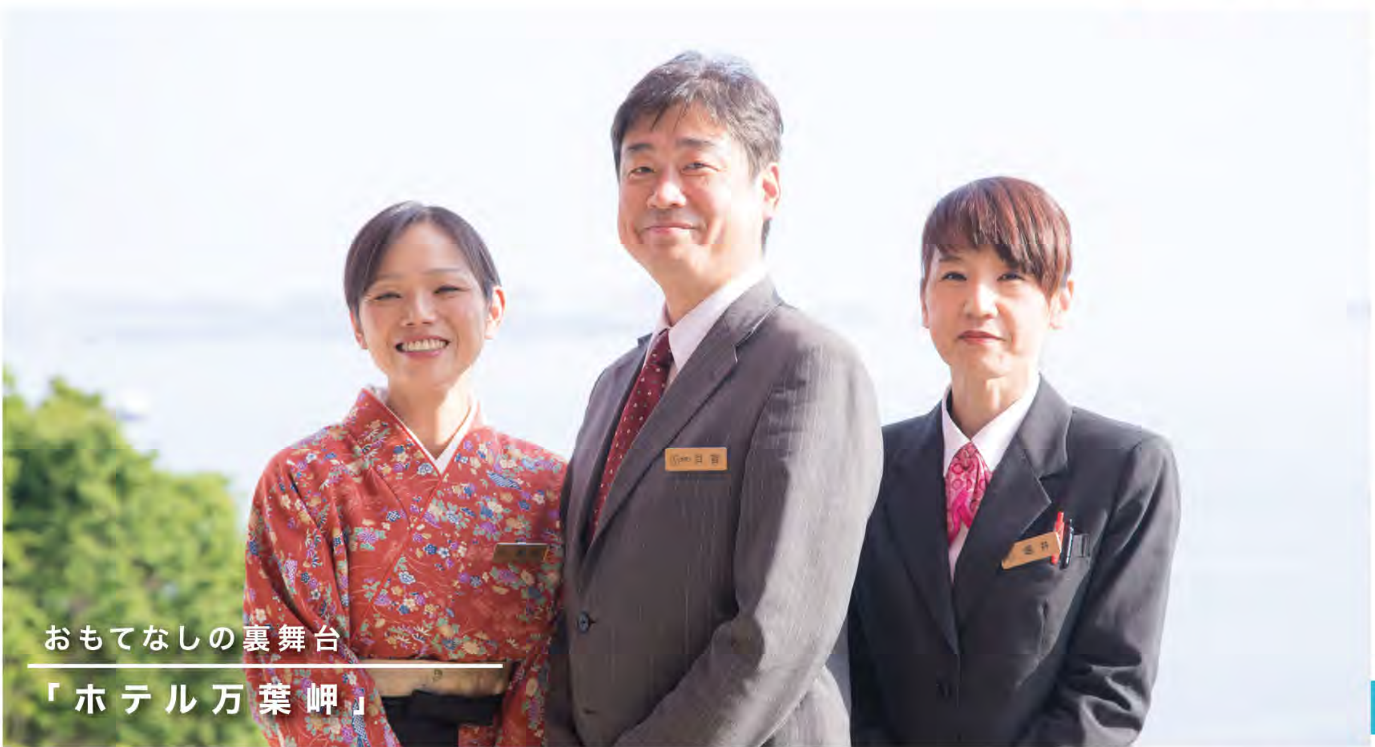
おもてなしの裏舞台