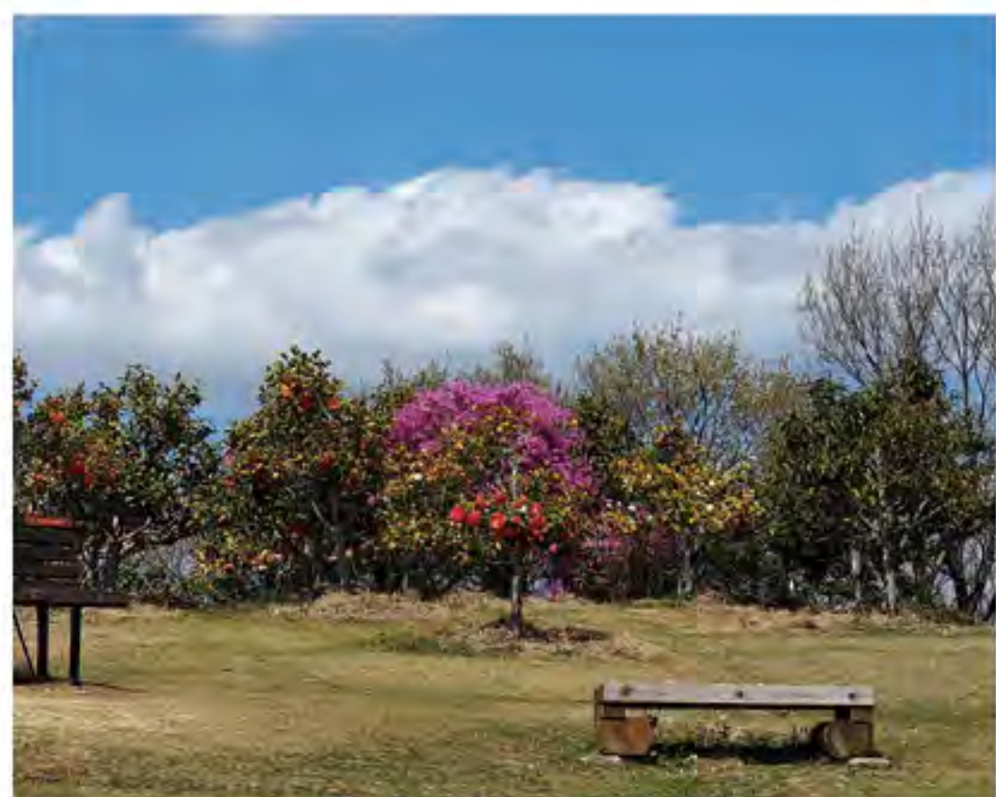
敷地内には恋人のベンチもあります。

お客さまに快適に過ごしていただくために、スタッフひとりひとりが考え、動くホテル万葉岬。今後は露天風呂や遊具も充実させ、幅広い世代が楽しめるような癒しのスポットを目指しています。