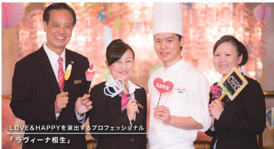
LOVE&HAPPYを演出するプロフェッショナル