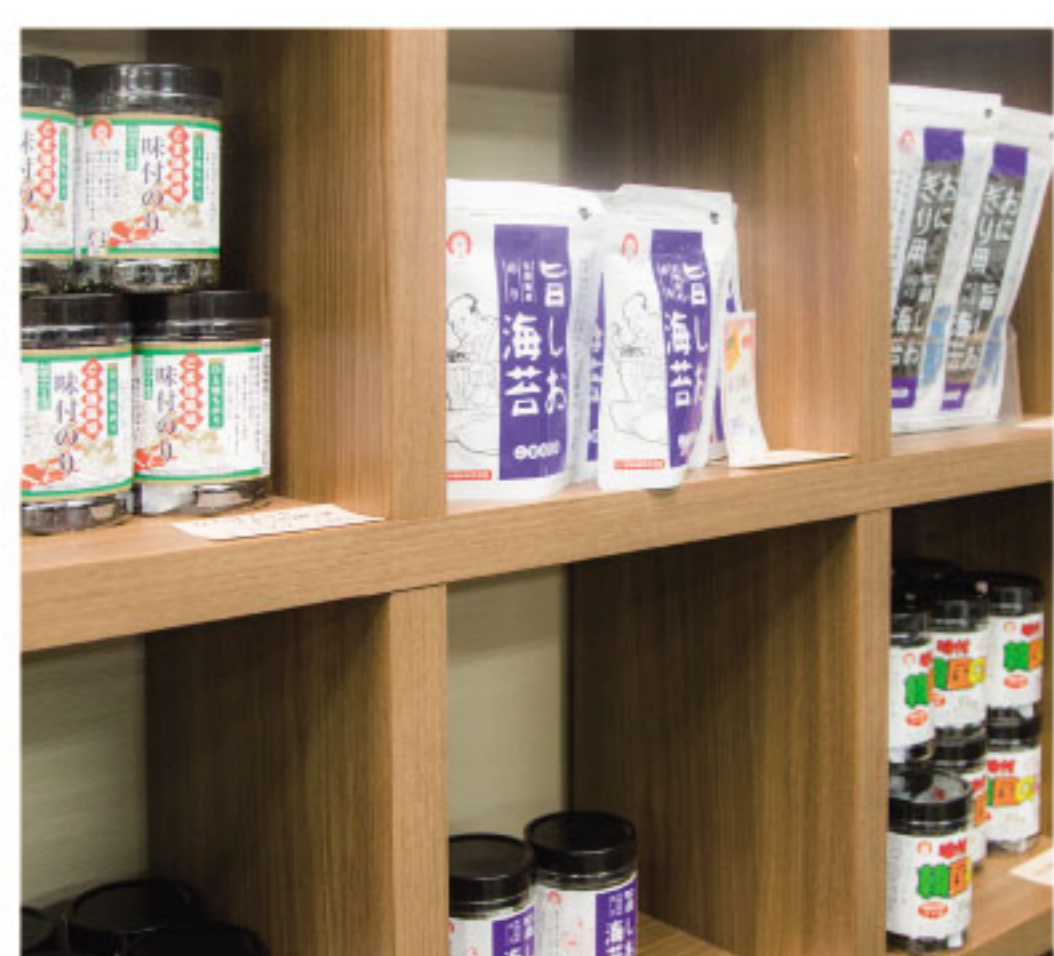
光海さんが取り扱う海苔商品もご説明いただきました