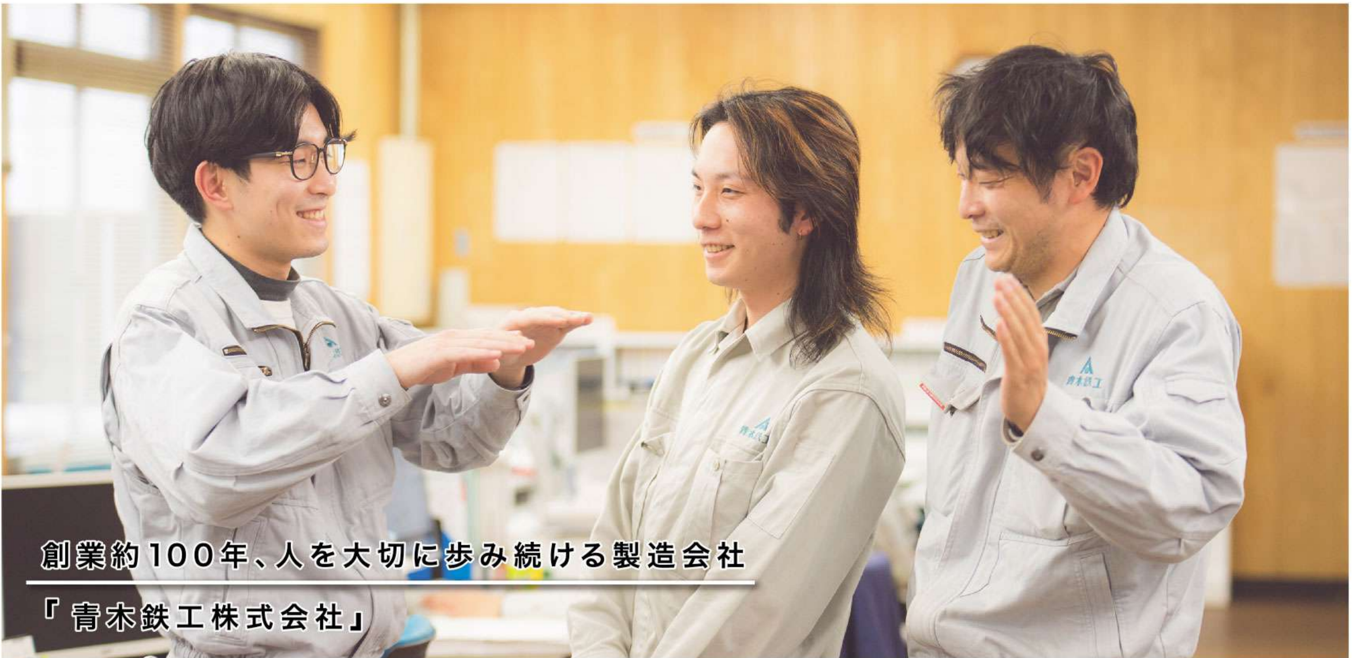
創業約100年、人を大切に歩み続ける製造会社