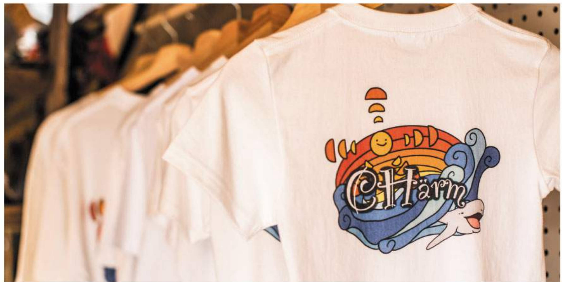
キラキラ坂をイメージしたオリジナルデザインのTシャツだそうです。