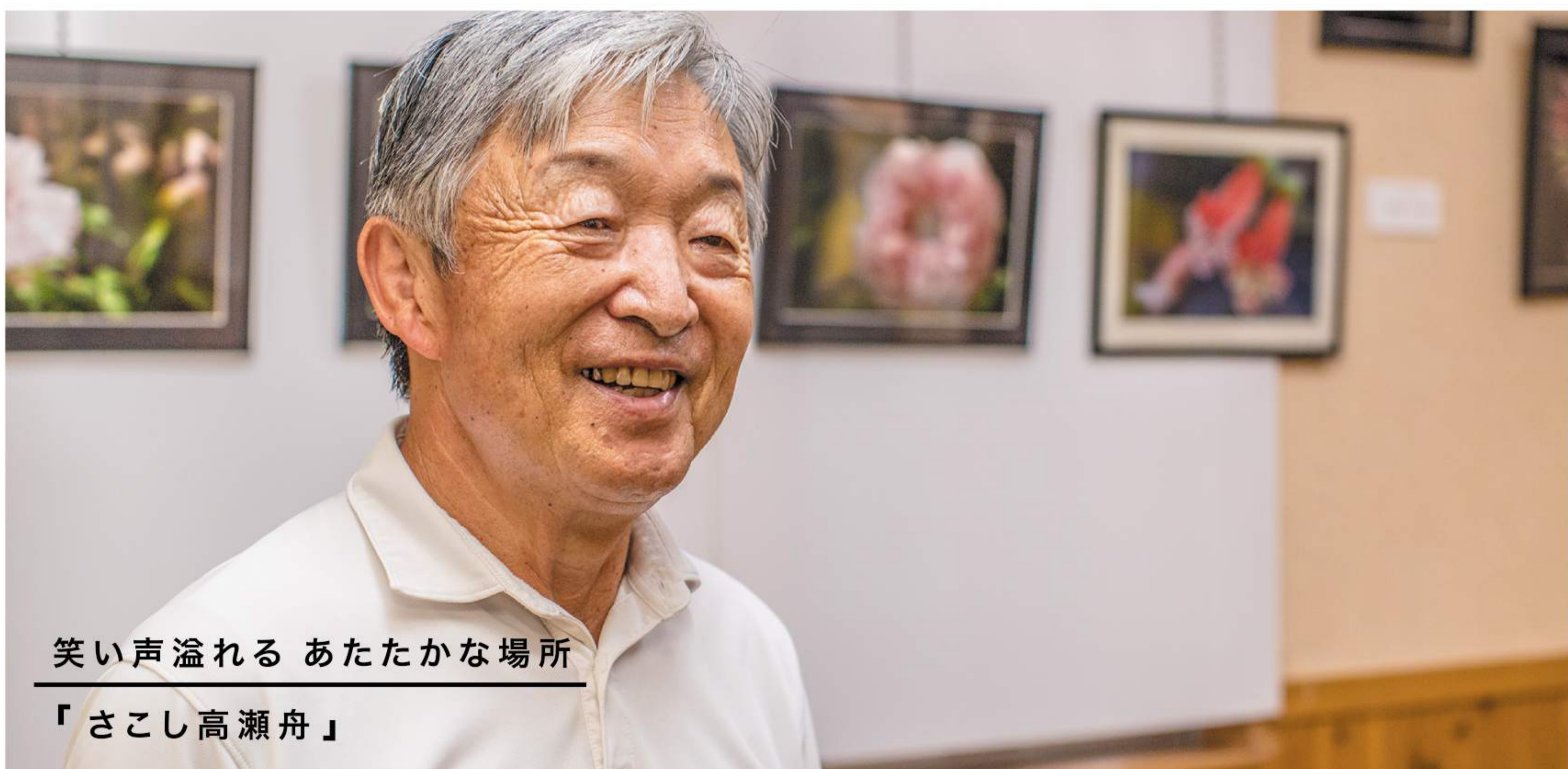
笑い声溢れる あたたかな場所