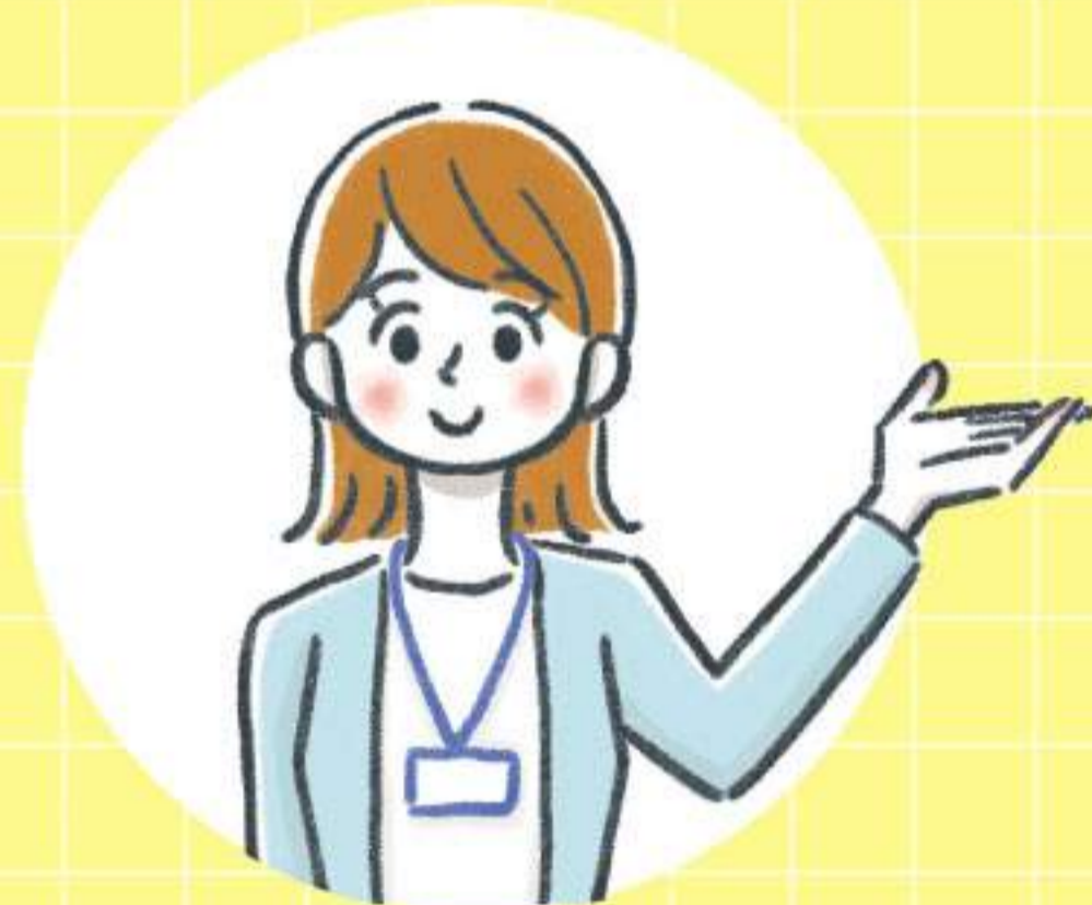
婚活アドバイザー