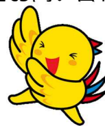
兵庫県マスコットはばタン

● 抽選はグループごとに行います。抽選結果は当落に関わらず、郵送にて代表者の方へお知らせします。