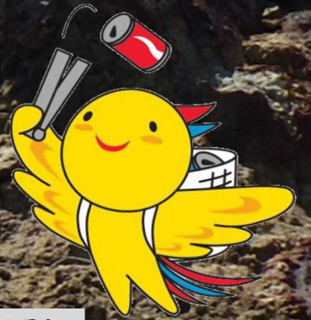
兵庫県マスコットはばタン