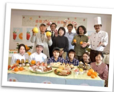
多彩な観光資源を有効活用するために赤穂スイーツを開発(赤穂市)

また、空き店舗の活用などまちづくりと一体となった商店街の再生や創業・起業しやすい環境づくりを進め、身近な地域商業の賑わいを取り戻そう。