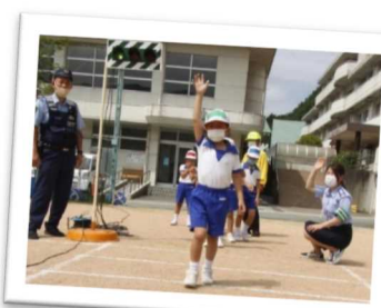
ルールやマナーを遵守し思いやりをもった人材を育成するための「交通安全教室」(宍粟市)

また、地域でパトロールを実施するなど、防犯意識や交通安全意識を高め、家庭や学校、地域が連携して犯罪や事故などのない安全な地域をめざそう。