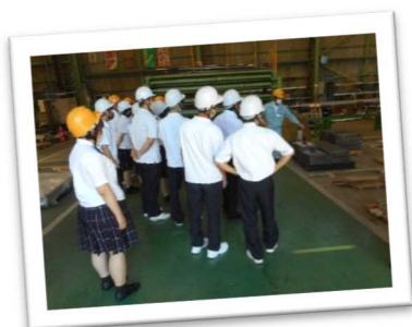
佐用高校生による水門などの設備製造を行う地元企業の見学(佐用町)

また、テレワークなどデジタル技術の発達により、働く場所や住む場所の自由度が増すことで、ほどよい田舎暮らしに関心のある人々を全国から呼び込むため、身近に農を楽しむ環境、豊かな自然や安全に暮らせる環境、人と人とのつながりなど、みんなで西播磨暮らしの魅力を情報発信し、西播磨に関わり続けてくれる人や移住してくれる人を増やそう。