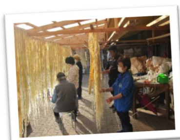
就労支援施設「えん花園」にて農福連携で取組むミツマタの乾燥作業(佐用町)