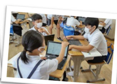
小中学校において1人1台端末を活用した授業を実施(たつの市)