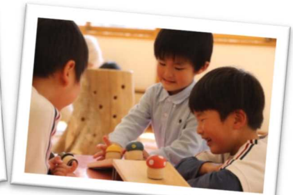
「木育」推進の一環として宍粟材を使った木のおもちゃが揃う「子育て支援センター」(宍粟市)