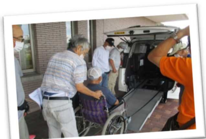
ボランティアグループによる通院等外出介助(太子町)