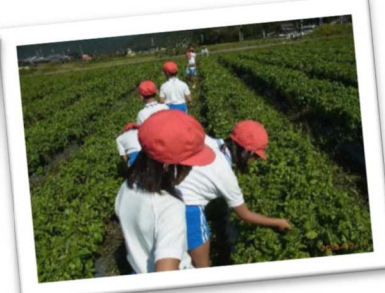
地元の特色ある農作物について生産者から学ぶ小学生の地産地消体験（たつの市）