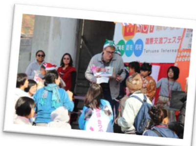
様々な国や地域の文化とふれあい交流する「国際交流イベント」(たつの市)

多様な価値観や異なる文化を持つ人への理解と共感を深め、地域に興味を持っている外部の人や外国人など多様な人を受け入れる地域をめざそう。多様な人が地域に関わり新たな担い手として活躍するなど、地域の持続と活性化に多様な人材を活かそう。