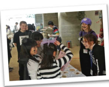
住民と地域で暮らす外国人が交流する「国際ふれあいまつり」(奥栗市)