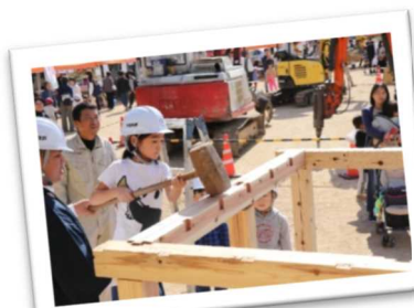
市内企業や事業所による「産業展」で大工作業に挑戦する子どもたち(宍粟市)

また、豊かな自然環境を活かしたこの地ならではの体験教育などにより、その教育環境に魅力を感じ、移住先や農山漁村留学先として西播磨を選んでもらえるような地域をめざそう。