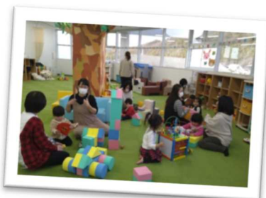
子育て世代が情報交換の場として自由に交流する「子育てつどいの広場」(たつの市)