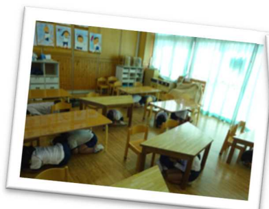
「シェイクアウト訓練」で地震から身を守るための安全確保行動をとる保育園児（太子町）

さらに、自主防災組織の強化や災害弱者を地域で支え合う体制づくりなど、共助による地域防災力を高め、行政とも連携した災害に強い安全安心な地域をつくろう。