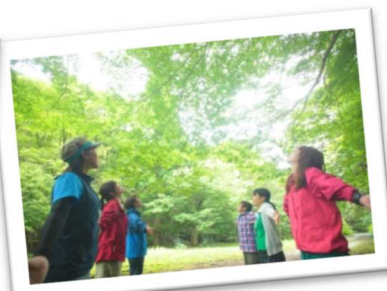
森林がもたらす心と身体の癒やし効果が科学的に認められた「森林セラピー」（宍粟市）