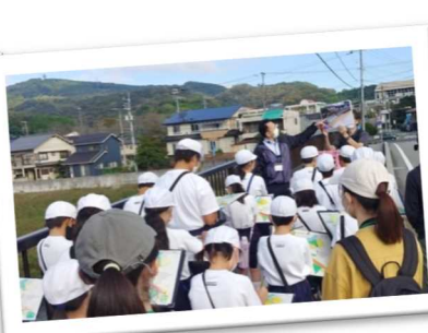
地域の小学校で実施した平成21年台風9号災害を学ぶ「防災まち歩き」（佐用町）