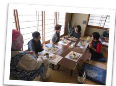
だれもが気軽に参加できる地域の寄り合いの場「ふれあいいきいきサロン」(佐用町)