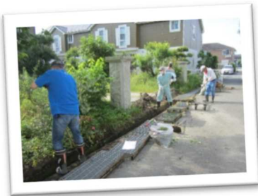
住民が主体となって地域の課題解決に取り組む活動(たつの市)

また、結婚を希望している人には、地域全体で出会いの場や縁結びを応援する取組みを広げよう。