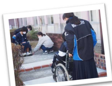
関西福祉大学が地元中学生に実施する福祉体験学習（赤穂市）

また、関係機関とも連携した医師の確保や地域医療体制の充実に取り組む、誰もが住み慣れた地域で適切な医療・介護サービスが受けられる地域をめざそう。