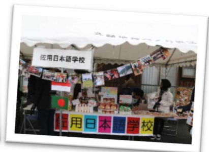
年末恒例「久崎市」での佐用日本語学校の学生有志による出店(佐用町)