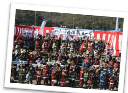
地域の歴史資源を活かし内外に地域の魅力を発信する「白旗城まつり」(上郡町)