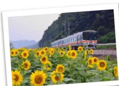
年間乗車人員300万人の維持を目標にJR姫新線利用促進運動を展開(たつの市・佐用町)

さらに、公共交通不便地域において、コミュニティバスの運営や住民相互による助け合いなど、地域が協働して地域ニーズにあわせた多様な移動・送迎支援サービスを充実させ、買い物や通院など誰もが移動しやすく、交通事故もない安心して外出できる地域をめざそう。