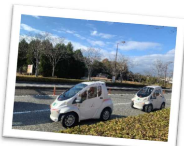
播磨科学公園都市内の公道を走行する超小型EV

さらに、新しい技術を用いた生活支援サービスの実証試験を播磨科学公園都市内で行うなど、住み慣れた地域で生活を維持していくための新たな地域モデルを構築する取り組みを進めよう。