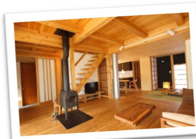
森林資源の地域循環にもつながる地元材を多用した木の温もりを感じられる住宅（宍粟市）

西播磨全体で食料や木材、エネルギーなどの自給力を高めつつ、近接する他圏域とも交流を進め、さらに循環を活発化させよう。