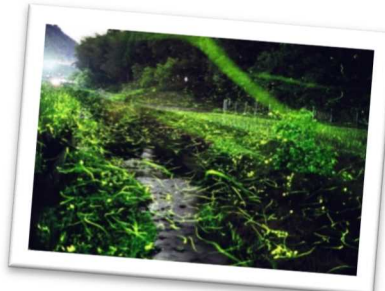
清流に飛び交うホタル（佐用町）