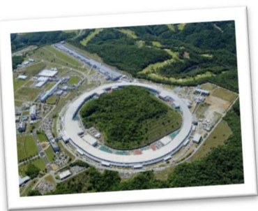
大型放射光施設「SPring-8」とX線自由電子レーザー施設「SACLA」