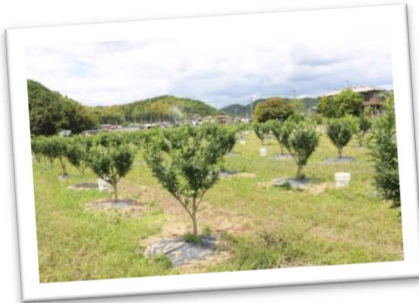
耕作放棄地を活用した地域住民によるサンショウの栽培(太子町)

耕作放棄地や空き家、空き施設などの遊休資源や森林などの豊かな地域資源を有効活用し、地域外住民との交流や賑わいづくり、食料品・日用品販売などの生活関連サービスや再生可能エネルギーを活用した事業化など、地域内で生産と消費活動が循環する経済活動のしくみをつくるなど、持続可能で自立した地域をめざそう。