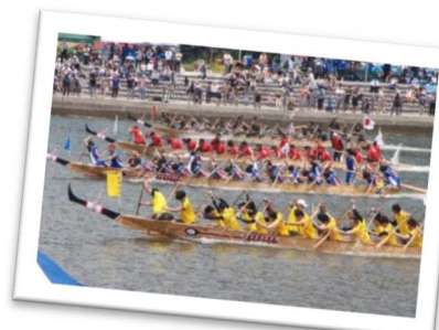
地域外からも多くの観光客で賑わう「ペーロン祭(令和4年ペーロン伝来100周年)」(相生市)

また、西播磨地域の特性を活かし、県境を接する岡山県や鳥取県との様々な分野での交流や連携を深め、互いの魅力を高め合い、地域の活性化につなげよう。