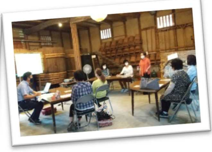
旧酒蔵を交流拠点等として活用する地域住民が運営する「ギャラリーひがし蔵」(上郡町)