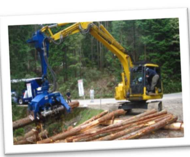
将来の林業人材を育成する県立森林大学校オープンキャンパスでの林業機械操作(宍粟市)