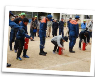
住民一人ひとりが防災意識を高めるための自治会主催による「防災訓練」（相生市）