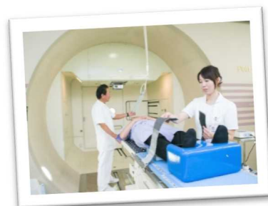
世界有数の先進医療施設「国立粒子線医療センター」（たつの市）