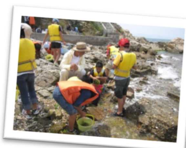
豊かな自然環境の大切さを認識するための環境体験（植物や生物の観察）（相生市）

水と緑に恵まれた西播磨の豊かな自然環境の大切さを認識するとともに、森林・農地が持つ多面的な機能（食料や木材などの自然の恵みだけではなく、自然災害を防いだり、癒やしや学習の場など）の維持や生態系を守る取組、自然から得られる資源を地域で有効に活用するなど、自然環境を守り育てながら人と自然が共生した持続可能な地域をめざそう。