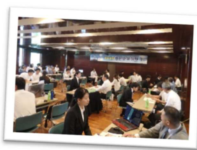
若者等に地元企業の良さを紹介する合同企業説明会(相生市)