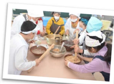
食を支える農林水産の大切さを認識する地元食材を使った料理教室（相生市）