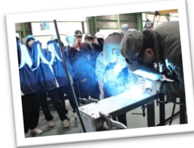
千種中学校生による金属加工を行う地元企業の見学(宍粟市)