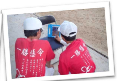
運動部活動に外部指導員及びICT指導を導入し、部活動の活性化を促進(赤穂市)