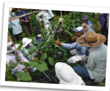
農業技術を継承・普及させるために取組んでいる講座「さよう農の匠」(佐用町)