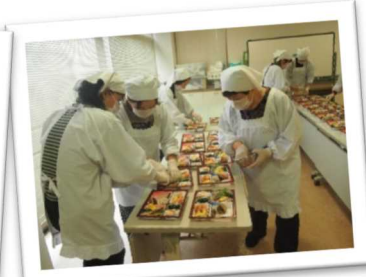
ひとり暮らし高齢者等を対象にお弁当を調理・配食し、声かけする「給食サービス」(太子町)