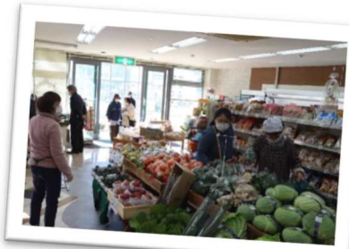
地域住民のための買い物拠点としてオープンした地域住民が運営する「にこにこマーケット」(奥栗市)