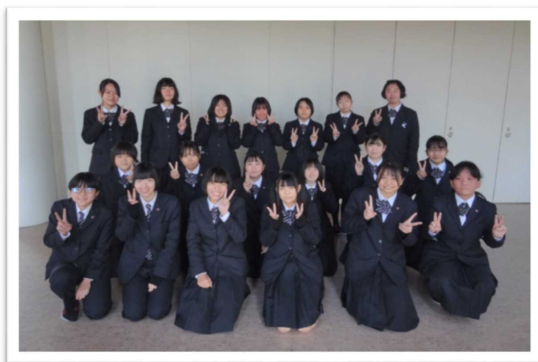
この冊子に使用しているピクトグラムは、兵庫県立龍野北高等学校総合デザイン科の生徒(3年生)の作品です。