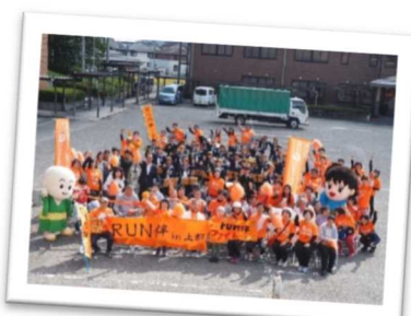
認知症の方が毎日笑って暮らせるまちづくりを目指す認知症啓発（上郡町）