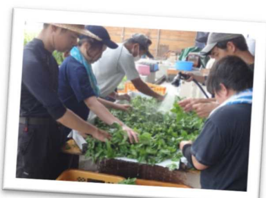
地元企業と協力し農福連携でバジル栽培・加工業務を行うNPO法人(たつの市)