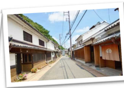
近世から近代にかけて発展した醸造町の歴史的風致を伝える「龍野重要伝統的建造物群保存地区」(たつの市)