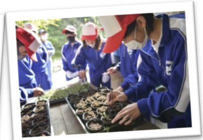
地域の魅力アップのため住民と一緒にハーブの種まきを行う有年中学校生(赤穂市)