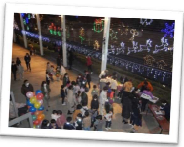
播磨科学公園都市内の住民や学生等が企画運営する「光都イルミネーション点灯式」