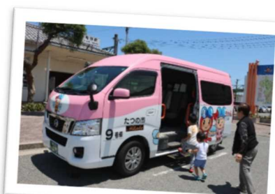
自宅から目的地まで乗り合いで送迎する市民乗り合いタクシー「あかねちゃん」(たつの市)