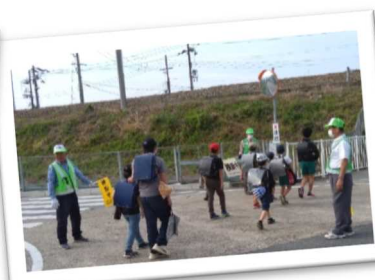
地域コミュニティの活性化にも寄与する地域ぐるみで取組む登下校の見守り活動(赤穂市)