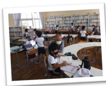
社会参加として放課後子ども教室で子ども達に勉強を教える地域住民(上郡町)

また、家庭や地域、職場において、男女ともに働ける環境づくりを進め、「性別などによる役割分担意識」のない地域をめざそう。