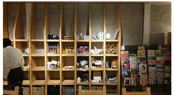
コバコ店内には、ハンドメイド作品を委託販売できるレンタルボックスがある