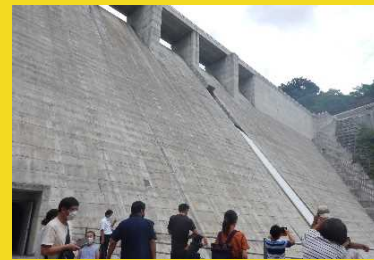
かなじ 金出地ダム

平成30年に完成した新しいダムで、今回のイベントでは、普段入ることができないダムの堤体内部を特別に見学できます。