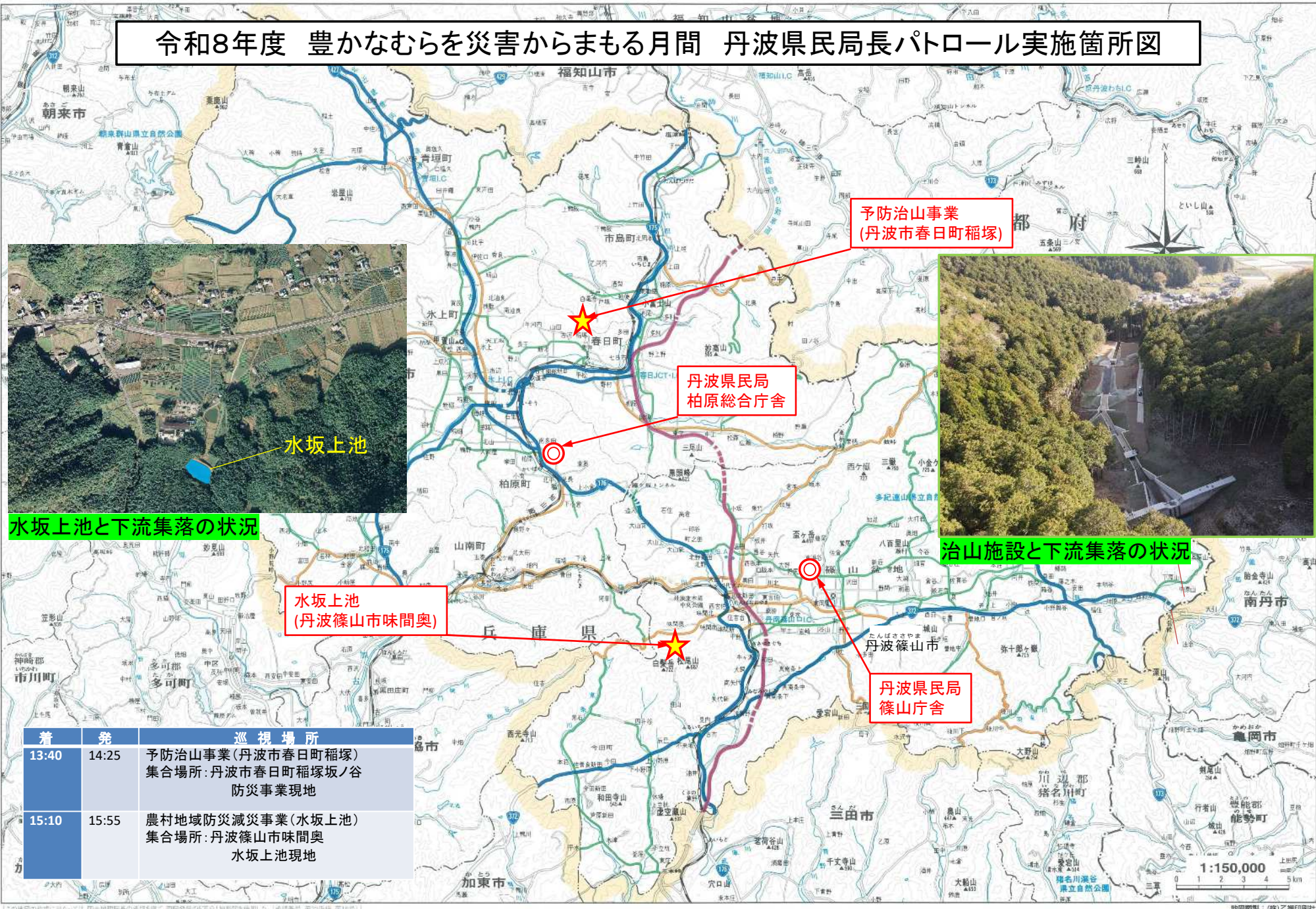
水坂上池と下流集落の状況