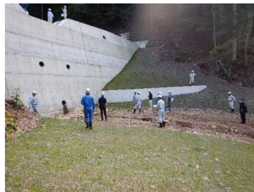
昨年度の県民局パトロールの様子

・篠山土地改良事務所パトロール 〔(要監視ため池、地すべり防止区域点検) 大谷池（丹波篠山市岩崎）、水谷口池 （丹波篠山市今田町上小野原）、宮ノ下池 （丹波市春日町野上野）、鴨池（丹波市市島町 中竹田）、地すべり防止区域（丹波市市島町 徳尾）他〕