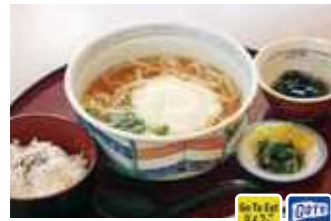
ユニトピアささやま 5 丹波篠山山の芋とろろうどん・そば定食 【価格】1,250円 【所】丹波篠山市矢代231-1 【時】11:30~14:00 【休】無休 【問】079-552-7227