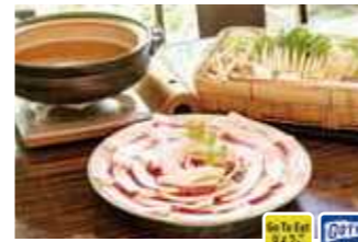
丹波篠山 近又 16 ぼたん鍋 【価格】赤身使用7,920円、ロース肉使用10,230円、ロース肉使用・ぼたん焼付12,540円 【所】丹波篠山市二階町81 【時】11:00~19:00 【休】不定休 【問】079-552-2191