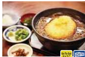
ひいらぎや 1 山芋揚げそば 【価格】1,650円 【所】丹波篠山市二階町56 【時】11:30~16:00 【休】木 【問】079-552-5965