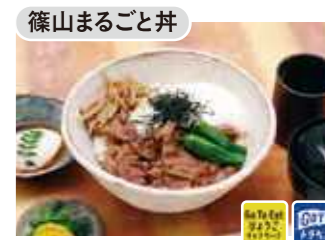
篠山まるごと丼 25 篠山牛すきとろろ丼 【価格】1,848円 【所】丹波篠山市中野76-4 【時】10:00~14:00 【休】火 【問】079-594-2611