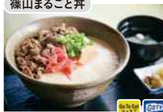
篠山まるごと丼 26 丹波篠山牛しぐれ丼 【価格】1,320円 【所】丹波篠山市黒岡70-1 【時】11:00~16:30/土日祝11:00~17:00(L.Oは30分前) 【休】水 【問】079-552-3386