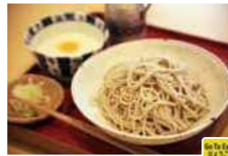
そば切り 花格子 4 山の芋つけとろろ蕎麦 【価格】1,400円 【所】丹波篠山市河原町160 【時】11:30~14:00/17:30~20:00 そばが売切れ次第終了 【休】日曜夜・月(祝日の場合は翌日)、年末年始 【問】079-552-2808