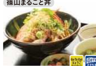
篠山まるごと丼 27 丹波篠山まるごと丼セット 【価格】1,190円 【所】丹波篠山市西木之部字江の田の坪舞鶴若狭自動車道上り線 【時】レストラン(平日)11:00~15:00、(土日祝)11:00~20:00 【休】無休 【問】079-593-1291