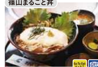
篠山まるごと丼 29 丹波牛とろろ飯 【価格】1,320円 【所】丹波篠山市今田町上立杭3 【カーナビ】「丹波伝統工芸公園 陶の郷内」で入力 【時】10:00~17:00 【休】火 【問】079-597-2173