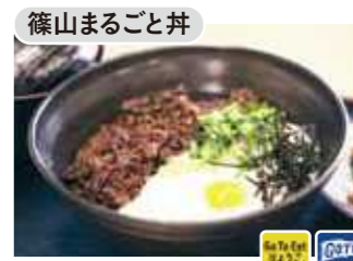
篠山まるごと丼 24 猪肉とろろ丼 【価格】1,100円 【所】丹波篠山市黒岡18 【時】11:00~16:00 【休】不定休 【問】079-552-4888