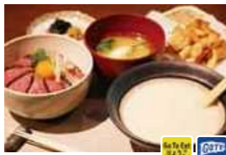
りょうり舎やまゆ 9 牛とろろ丼膳 【価格】2,860円 【所】丹波篠山市網掛81 【時】11:00~15:00(L.O) 【休】火 【問】079-590-1261