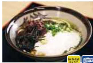
味処みたけ本店 3 猪肉とろろうどん・そば 【価格】1,000円 【所】丹波篠山市黒岡683 【時】11:00~17:00 【休】不定休 【問】079-552-1385