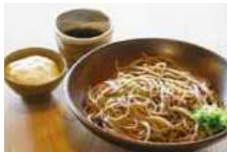
自然薯庵 6 とろろそば(冷) 【価格】1,200円 【所】丹波篠山市真南条上947-8 【時】11:30~14:30 そばが売切れ次第終了 【休】水・第2第4木 【問】079-550-0727