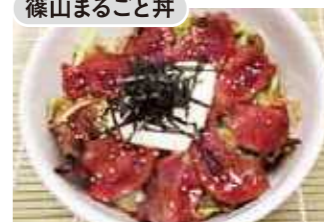
篠山まるごと丼 28 鹿肉のたたき山の芋トロロ丼 【価格】1,320円 【所】丹波篠山市東新町214-20 【時】11:00~13:30/17:30~22:00 【休】日・祝 【問】079-506-1967