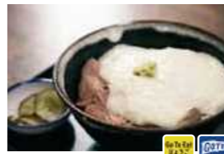
大手食堂 23 牛とろろ丼 【価格】1,100円 【所】丹波篠山市二階町55-1 【時】10:00~19:00 【休】12/30~翌1/2迄 【問】079-552-0660