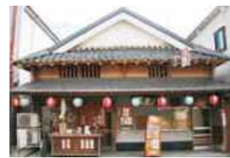
角清 13 にぎり盛りセット 【価格】1,300円、期間中は定食、セットの小鉢をとろろに変更します 【所】丹波篠山市二階町52 【時】12:00~15:00/17:00~22:00 【休】月 【問】079-552-0279