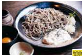
石臼挽き十割そば 夢左工門 7 山の芋とろろそば 【価格】1,600円 【所】丹波篠山市西岡屋209-3 【時】11:30~14:30 そばが売切れ次第終了 【休】火・水・木・金(祝日営業) 【問】079-552-3989