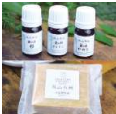
平成30年度 株式会社ささやまビーファーム(丹波篠山市) 篠山精油・篠山石炭