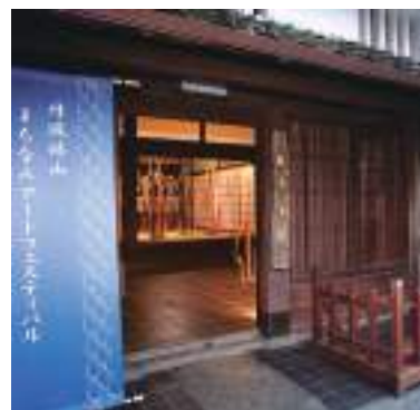
平成30年度 丹波篠山・まちなみアートフェスティバル 実行委員会(丹波篠山市) 丹波篠山・まちなみアートフェスティバル