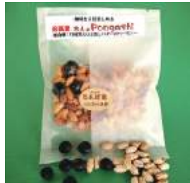
平成29年度 たんばJUNちゃん農園 (丹波市) 丹波発大人のPongashi