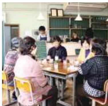
平成29年度 合同会社里山工房くもべ(丹波篠山市) 旧雲部小学校舎を活用した地域づくり