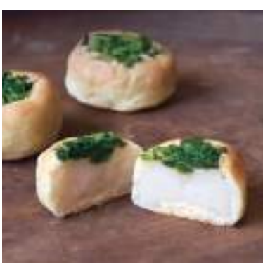
令和元年度 御菓子司 荒木本舗 (丹波市) あざみ菜まんじゅう