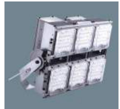
平成29年度 パナソニックライティングシステムズ株式会社 春日工場 (丹波市) LED投光器モジュールタイプ