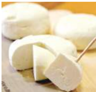
平成29年度 丹波婦木農場チーズ工房 (丹波市) ナチュラルチーズ サンマルセラン