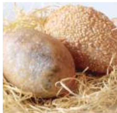
平成30年度 株式会社友縁 / 大連飯店 (丹波市) 丹波ゴールドエッグー栗一 丹波ドラゴンエッグー黒ごま一