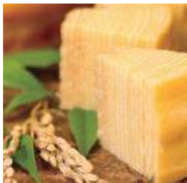
平成30年度 株式会社まさゆめさかゆめ (丹波市) 夢ばあむ