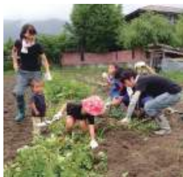
令和2年度 たんば JUNちゃん農園(丹波市) 快汗・共汗・楽農・楽食体験 in 丹波