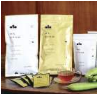
平成29年度 有限会社こやま園 (丹波市) 丹波なた豆茶