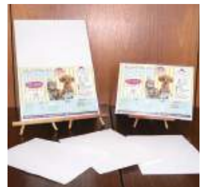
平成30年度 フォト・ブランニング(丹波市) クリーンライフプロ