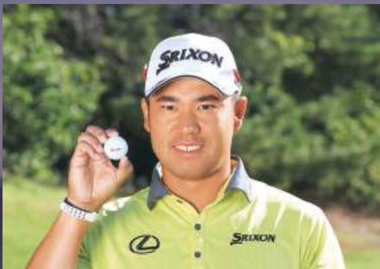
◀ 丹波製スリクソンゴルフボールを手に、笑顔の松山英樹選手

2021年のスポーツ界で最大の話題の一つとなった、ゴルフ海外メジャー大会「マスターズ・トーナメント」での松山英樹選手の優勝。アジア人として初となるこの快挙は、平成24年度に受賞したダンロップスポーツ株式会社(現・住友ゴム工業株式会社)市島工場製のゴルフボール、「SRIXON(スリクソン)Z-STARシリーズ」が支えたものでした。丹波製のゴルフボールが、松山選手の世界