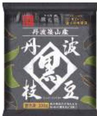
令和元年度 ケンミン食品株式会社 篠山工場 (丹波篠山市) 冷凍 丹波篠山産丹波黒大豆