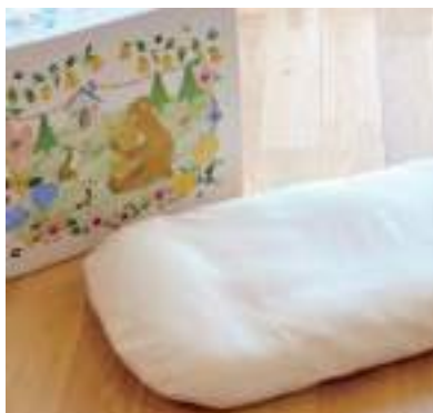
令和2年度 ジョリーメゾン株式会社(丹波市) ジョリーメゾンのトップンチーノ®