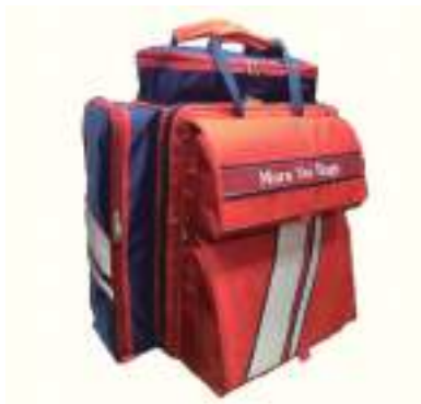
令和元年度 Maru Su Bags(丹波市) 医療・救急・防災用 フルオーダーバッグ