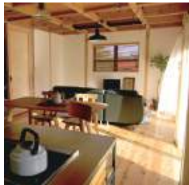
平成29年度 株式会社おいたて工務店(丹波篠山市) SETTE (企画住宅)