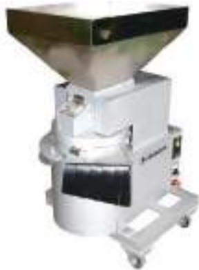
平成28年度 株式会社田村機械製作所(丹波市)※ 栗の鬼皮剥き機 ※平成29年で廃業。現在は株式会社東洋風圧で取り扱い