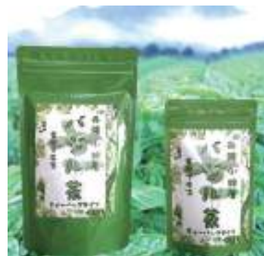
平成28年度 丹波小林屋(丹波市) バジル茶