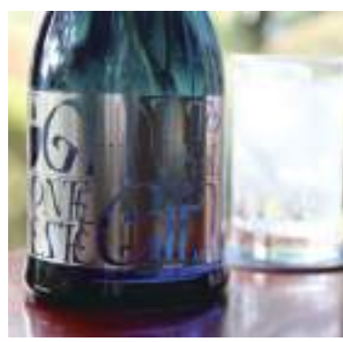
令和元年度 株式会社西山酒造場 (丹波市) 小鼓 モンテオエステ ジン