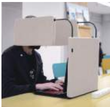
令和2年度 谷水加工板工業株式会社(丹波市) SEREN desk