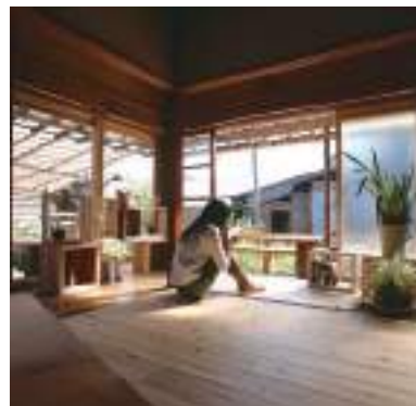
令和元年度 株式会社藤本林業所(丹波篠山市) 置き床生活