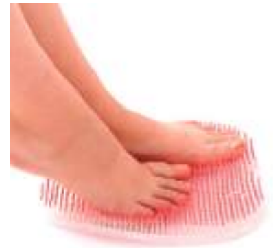
平成28年度 株式会社サンバック 市島工場(丹波市) フットグルーマー