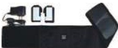
令和元年度 株式会社オオツキ(丹波市) ぬっくモーる