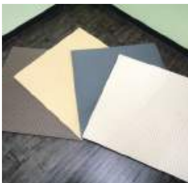
平成30年度 株式会社横谷(丹波市) フロアtatami