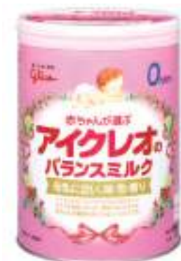
平成28年度 アイクレオ株式会社 柏原工場(丹波市) アイクレオのバランスミルク