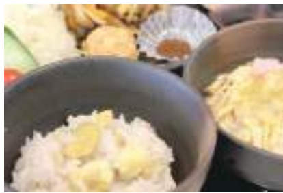
地域資源を活用した食事も「コト消費体験が楽しめる」