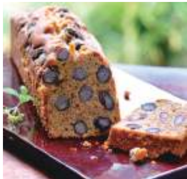
平成28年度 合同会社とあっせ (sasurai) (丹波篠山市) パティスリーバトン