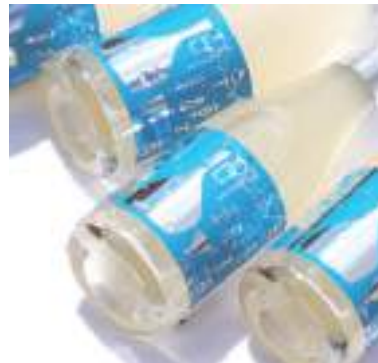
令和2年度 株式会社西山酒造場(丹波市) 丹波小鼓美白醇酒