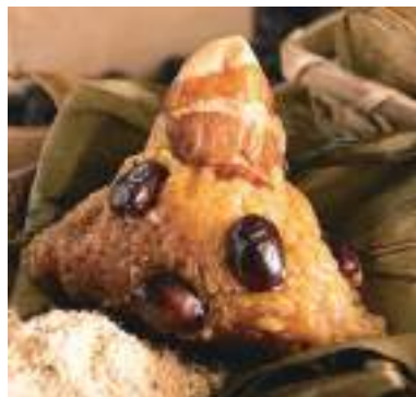
令和2年度 株式会社ナカタニ(丹波篠山市) 丹波黒豆肉粽(ちまぎ)