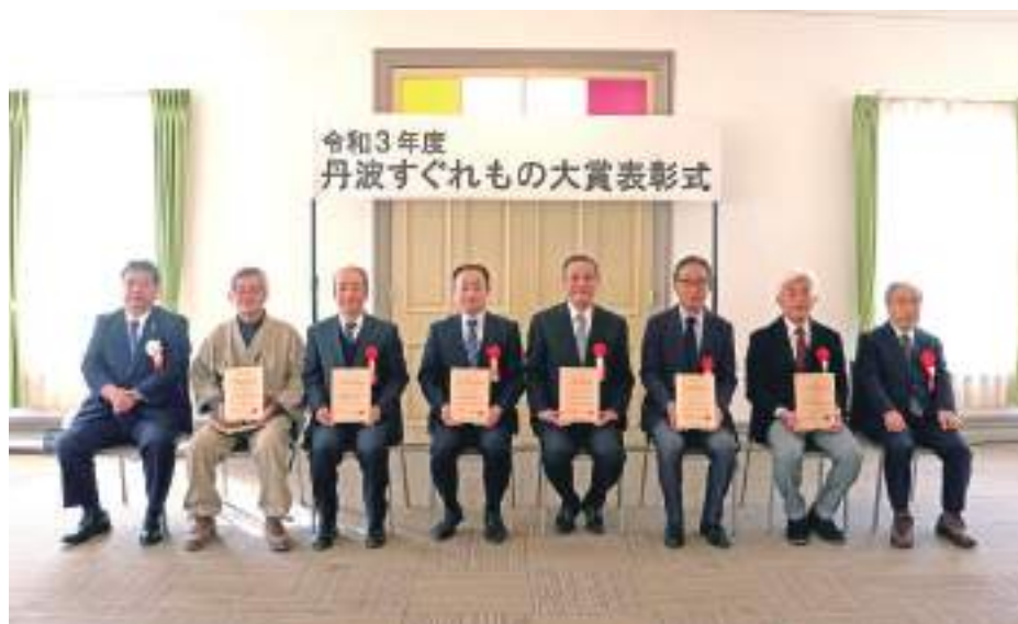
表彰式 令和4年3月7日