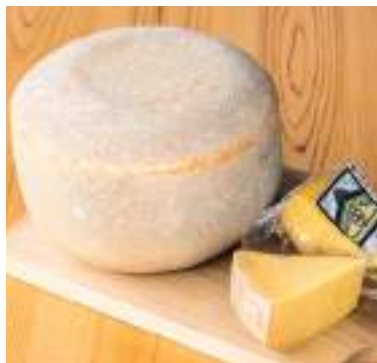
令和2年度 株式会社丹波婦木農場(丹波市) 蔵熟成ゴータ