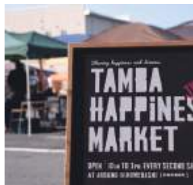
令和元年度 丹波ハビネスマーケット実行委員会(丹波市) 丹波ハビネスマーケット