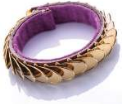
平成28年度 株式会社青山産業研究所(丹波篠山市) こはぜブレスレット