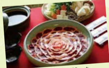
角切りの山の芋が入ったぼたん鍋