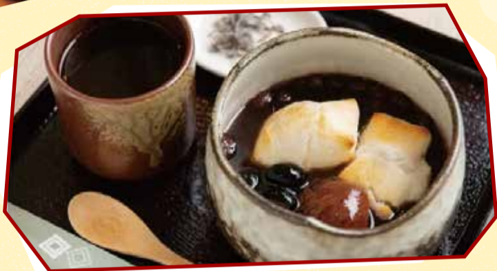
丹波栗と丹波黒大豆が入ったぜいたくなぜんざい

希少な丹波大納言小豆を使ったぜんざいが、お店自慢の味で楽しめます。餅や栗が入った「王道ぜんざい」、意外な食材と組み合わせた「創作ぜんざい」のほか、持ち帰り商品もあります。小豆模様ののぼりが目印です。