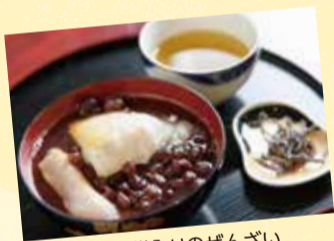
焼き餅入りのぜんざい