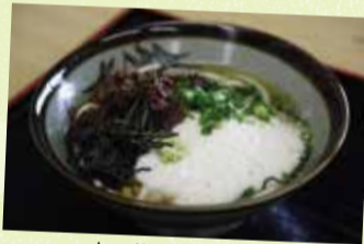
山の芋をたっぷり使ったとろろうどん