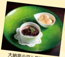
大納言小豆と丹波栗のプリュぜんざい