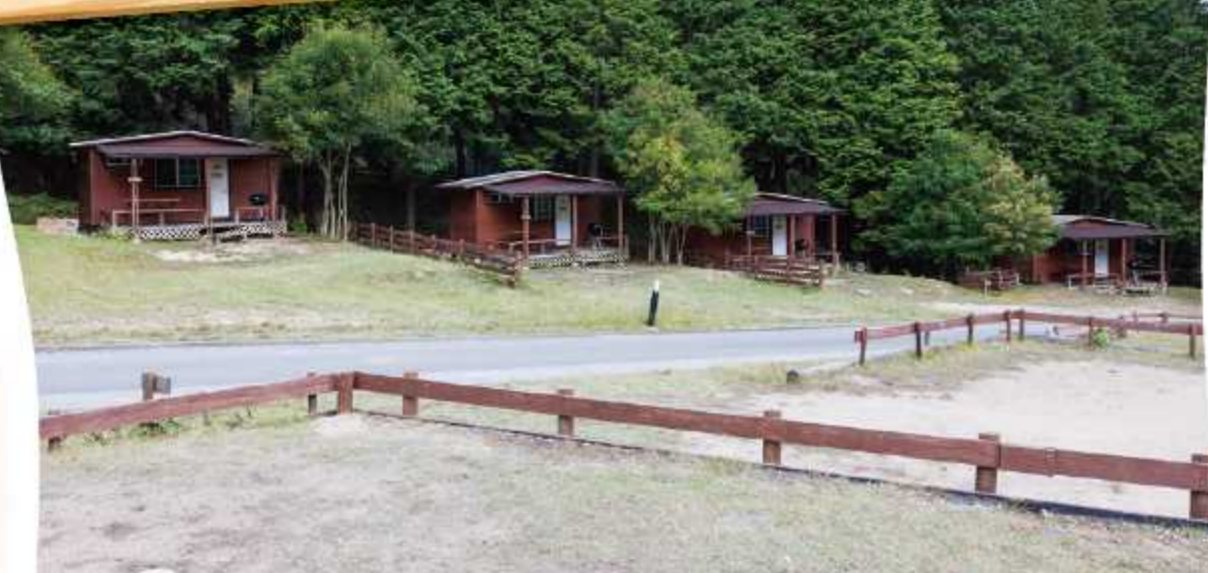
オートキャンプ場の前にあるトレーラーロッジ。 今度はテント以外でも泊まってみたい。