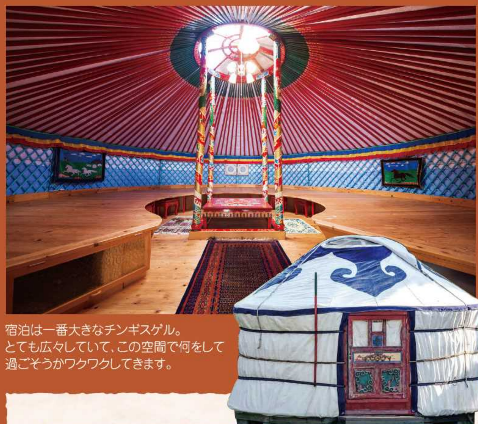
宿泊は一番大きなチングスゲル。 とても広々としていて、この空間で何をして 過ごそうかワクワクしてきます。

やまもりの湯の向かいに一歩足を踏み入ると、そこはもうモンゴル！ 煌びやかな民族衣装を身にまとい、レストラン モンゴルオルゴであたたかいモンゴル ティーをいたたき、リラックスタイム。室内に流れる民謡が、より一層モンゴルにいる気分 を高め、日本にいることをすっかり忘れてしまいます。ここは丹波篠山モンゴルの里。モン ゴルから運んできたゲルは全部で5つ。1日1組限定なので、周りを気にせず、思う存分案 しめるのも魅力的。宿泊者は焚き火や書道、瞑想などのオプションも体験できます。