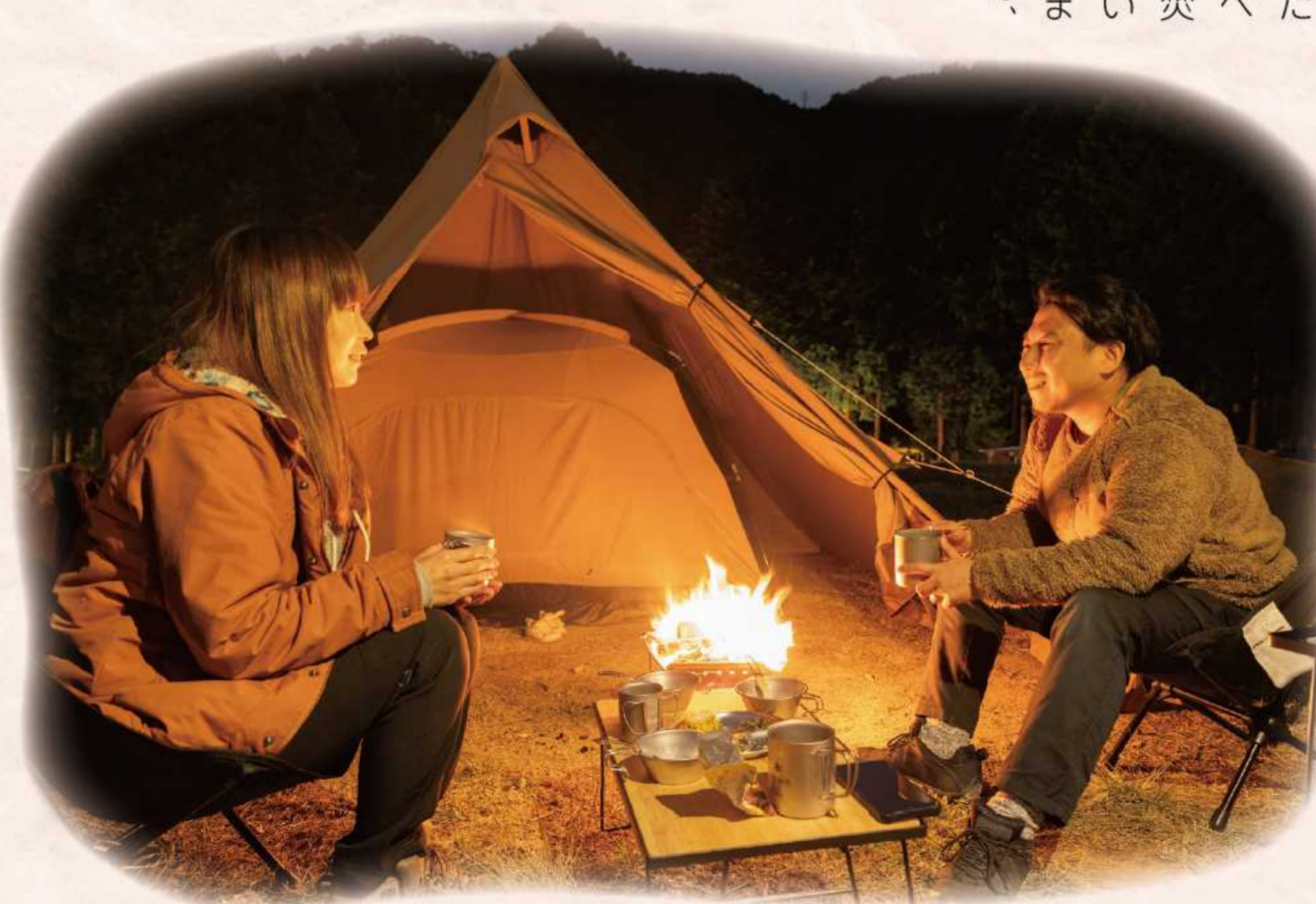
子どもが眠った後は、焚き火でゆったり大人時間。地ビールを飲みながら語り合います。ゆらゆら揺れる火は、いつまでも見ていられます。