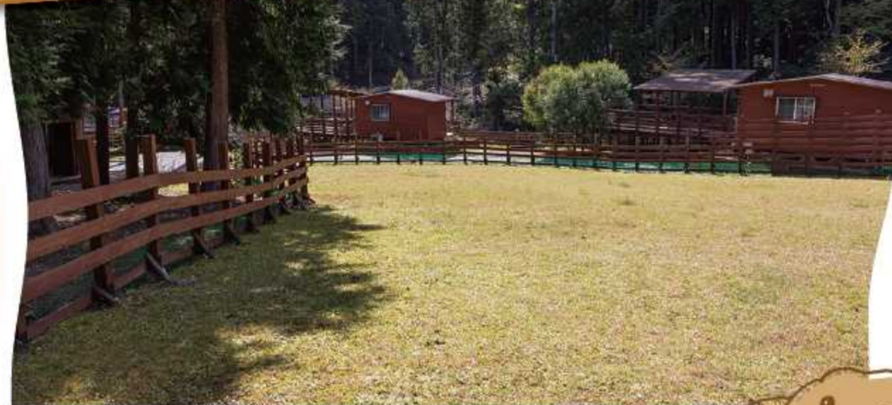
ワンちゃんと一緒にキャンプも楽しめます。 ドッグランは広々としているので、ノードでたくさん走れるのが魅力的。