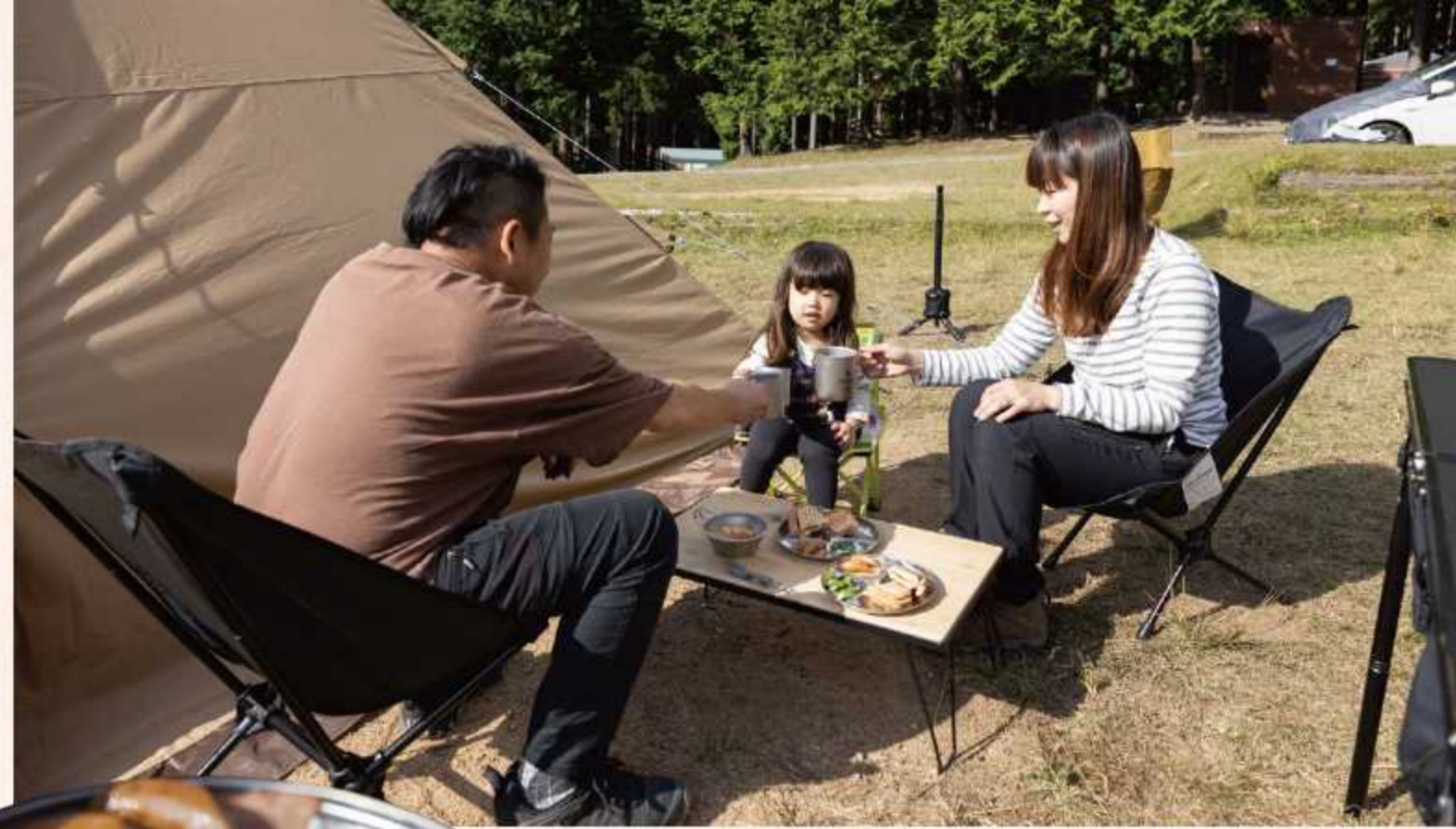
朝食はホットサンド。 朝日をいっぱい浴びながら食べる朝ごはんは、いつもの何百倍もおいしいです。