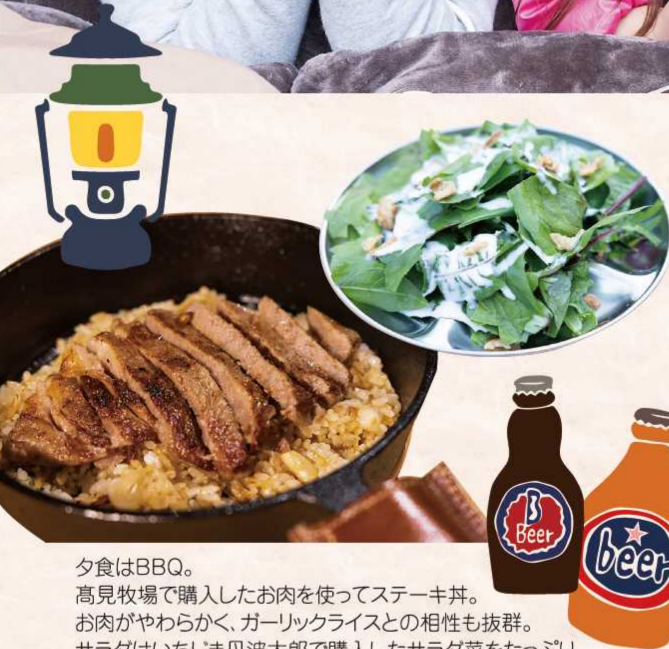
夕食はBBQ。 高見牧場で購入したお肉を使ってステーキ丼。 お肉がやわらかく、ガーリックライスとの相性も抜群。 サラダはいちじま丹波太郎で購入したサラダ菜をたっぷり。