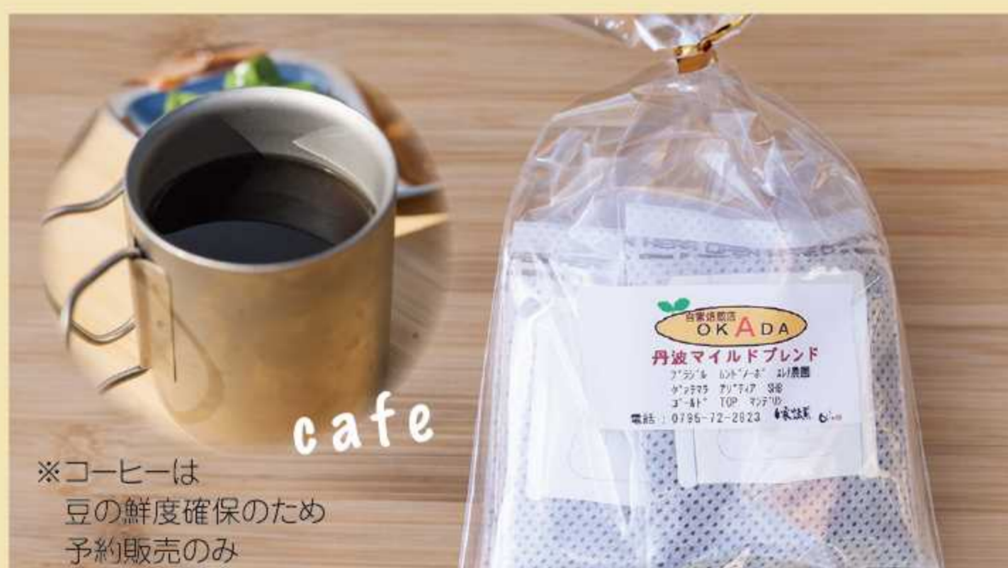
※コーヒーは 豆の鮮度確保のため 予約販売のみ