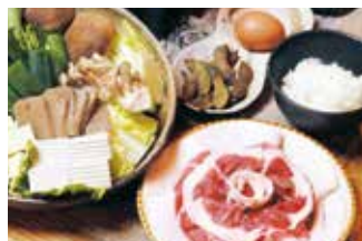
丹波篠山囲炉裏料理 いわや ⑭