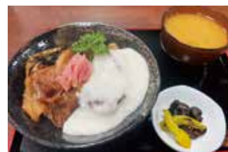
城下町食堂 篠山飯 ⑳

【価格】1,320円 【所】丹波篠山市今田町上立杭3 【カーナビ】「丹波伝統芸公園陶の郷内」で入力 【時】10:00～17:00 【休】火 【問】079-597-2173