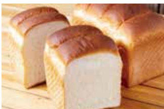
Bakery HikoOKI ㉓

【価格】400円(1個)他にも、丹波栗をまるごと山の芋で包み込み蒸しあげた「玉水」(6個入1,950円)も販売しております。 【所】丹波篠山市北新町121-1 【時】9:00～18:00 【休】火 【問】079-552-0453