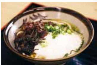
丹波篠山味処みたけ本店 ②

【価格】1,980円 【所】丹波篠山市二階町56 【時】11:30～売切れ次第終了 【休】木 【問】079-552-5965