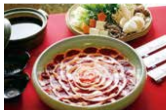
活魚割烹 宝魚園 ⑮

【価格】8,800円 【所】丹波篠山市火打岩495-1 【時】11:00～(要予約、最終入店18:00) 【休】木曜・不定休(4月～9月)、不定休(10月～3月)、年末年始 【問】079-552-0702