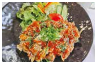
大正ロマン館(カフェ・レストラン マールコッテ) ⑨

【価格】4,950円 【所】丹波篠山市呉服町32 【時】11:00～14:00/17:00～21:00 【休】無休 【問】079-554-2266