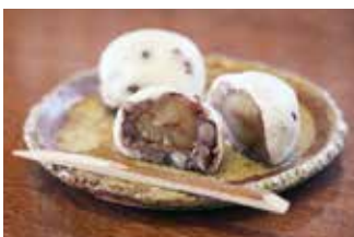
丹波栗菓匠大福堂 ㉒

【価格】2,970円(720ml)/770円(130ml) 【所】丹波篠山市味間新391-2 【時】10:00～18:00 【休】不定休(要電話) 【問】090-4271-5702