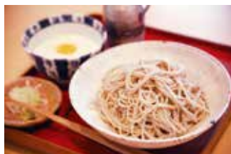
そば切り 花格子 ③

【価格】1,300円 【所】丹波篠山市黒岡683 【時】11:00～17:00 【休】不定休 【問】079-552-1385