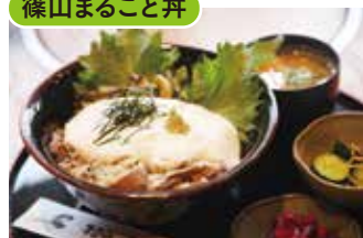
獅子銀 陶の郷店 ⑲

【価格】1,400円 【所】丹波篠山市黒岡70-1 【時】11:00～16:00(L.O.15:30) 【休】水 【問】079-552-3386