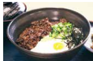
丹波篠山味処みたけ支店 ⑰