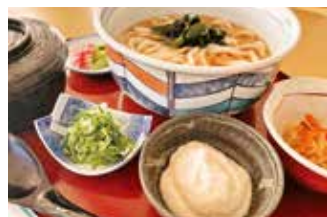
ユニピアささやま ④

【価格】1,800円 【所】丹波篠山市河原町160 【時】11:30～13:50/17:30～20:30 (予約可)蕎麦売切次第閉店 【休】日曜夜・月(祝日の場合は翌日)、年末年始 【問】079-552-2808