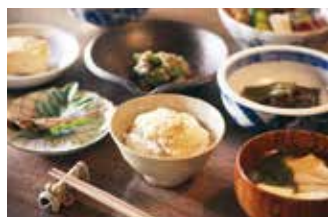
古民家の宿「集落丸山」 ⑩

【価格】1,700円 【所】丹波篠山市北新町97 【時】10:00～17:00(お食事は11:00～16:00) 【休】火曜日(その他臨時休館有り) 【問】079-552-6668