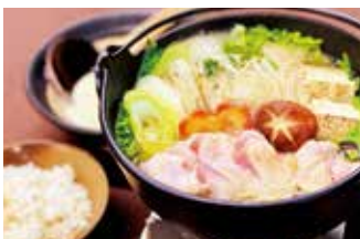
りょうり舎やまゆ ⑦

【価格】1,500円 【所】丹波篠山市二階町71 【時】11:00～売切れ次第終了(17:00以降はご予約にて承ります) 【休】不定休 【問】079-554-2777