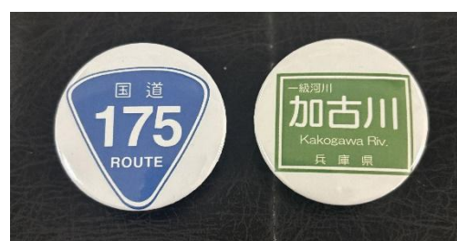
道路・河川缶バッチ