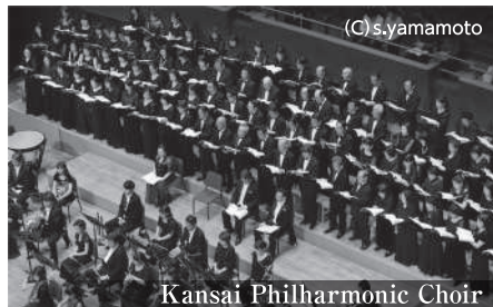
関西フィルハーモニー合唱団(合唱)