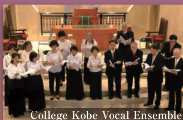
College Kobe Vocal Ensemble カレッジ神戸声楽アンサンブル (合唱)