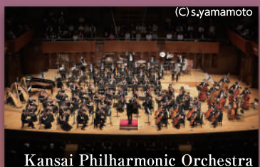
Kansai Philharmonic Orchestra 関西フィルハーモニー管弦楽団 (オーケストラ)