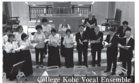
カレッジ神戸声楽アンサンブル(合唱)