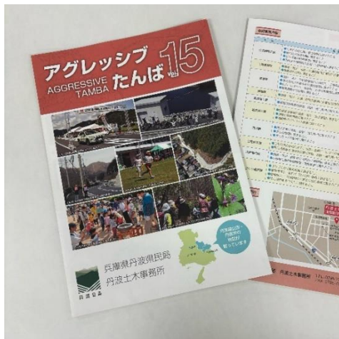
アグレッシブたんば Vol. 15

丹波土木事務所公式 Instagram「アグレッシブたんば」では、土木事務所の事業紹介・イベント情報などを発信しています。引き続きご覧ください。