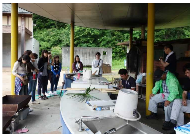
歴史文化ツーリズムゼミ(篠山市福住地区)