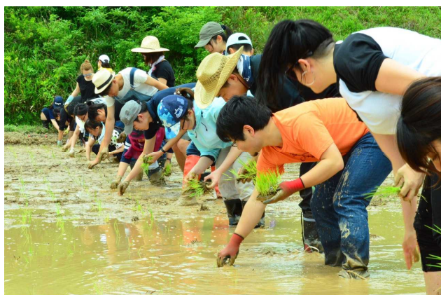
丹波の自然有機農法を学ぼう(丹波市市島町)