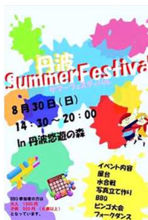
学生団体 Clown(丹波市柏原町新井地区)