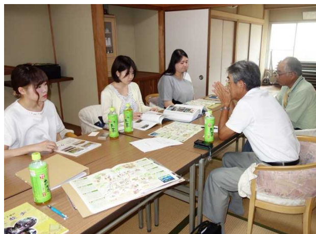
ミライの輪(丹波市山南町久下地区)