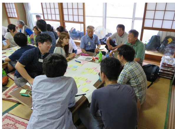
里山プロモーションチーム(篠山市桑原地区)