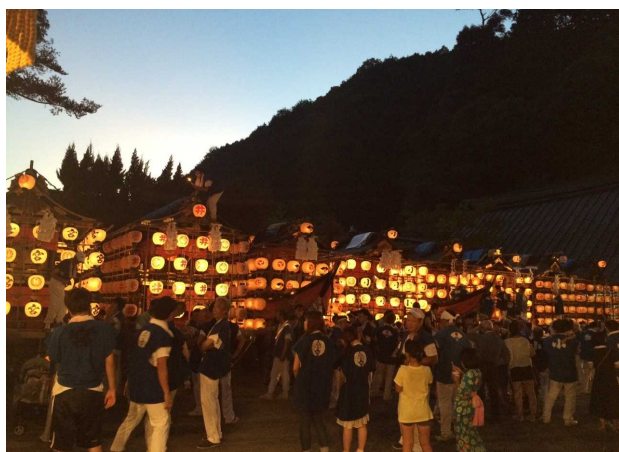
サンセット12(篠山市日置地区)