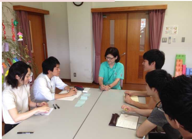
地域づくりプロジェクト(丹波市柏原町柏原地区)