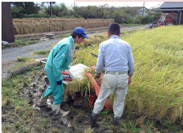
にしき恋(篠山市西紀南地区)