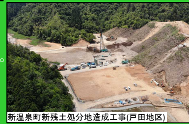
新温泉町新残土処分地造成工事(戸田地区)

戸田地区においては、新温泉町の新残土処分場の工事が進んでいます。浜坂道路Ⅱ期工事の残土もこちらへ搬入する予定です。