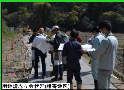
用地境界立会状況(諸寄地区)

諸寄高架橋(仮称)、新諸寄トンネル(仮称)及び新釜屋トンネル(仮称)の設計を進めています。