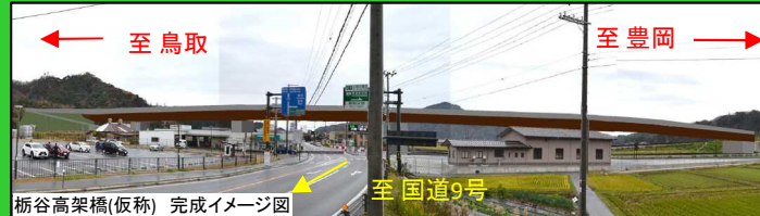
栢谷高架橋(仮称) 完成イメージ図

新温泉浜坂IC、栢谷高架橋(仮称)及び浜坂第1・第2トンネル(仮称)の設計を進めています。