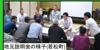
地元説明会の様子(若松町)