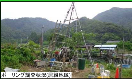
ボーリング調査状況(居組地区)

居組ICの詳細な設計のため、地盤調査を実施しました。写真はボーリング調査の状況です。