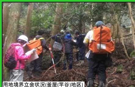
用地境界立会状況(釜屋(竿谷)地区)

釜屋(竿谷)地区では新釜屋トンネル(仮称)区間の用地境界立会を行いました。険しい山の中、立会に協力いただきましてありがとうございました。