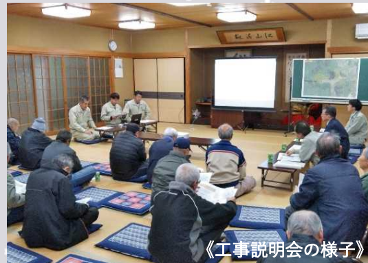
《工事説明会の様子》

12月2日(月)に居組地区で「居組IC改良工事(Aランプその1)」(受注者：株本建設工業(株))の説明会を開催しました。年明けから工事が本格化します。工事中、東浜居組道路において片側交互通行などを実施する可能性があります。できる限りご負担やご迷惑をかけないよう細心の注意を払い安全な施工に努めます。