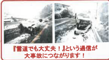
『雪道でも大丈夫!』という過信が 大事故につながります!

この時期、但馬地域の道路では「凍結」や「積雪」の可能性があります。 スリップ事故や登坂不能となる前に、冬用タイヤやタイヤチェーンを装着 してください。雪道でのスピードは控え、安全運転をお願いします。