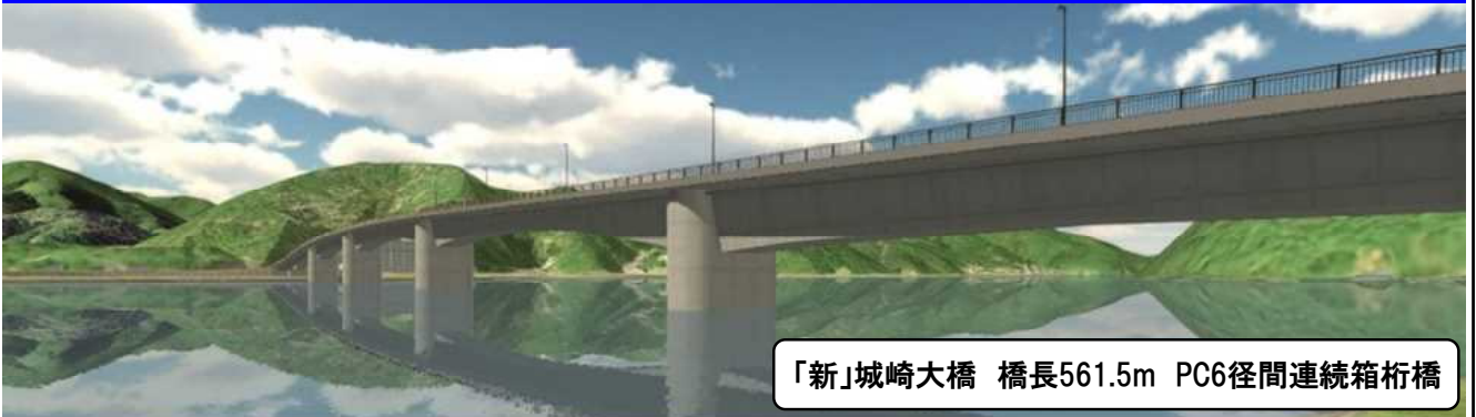
「新」城崎大橋 橋長561.5m PC6径間連続箱桁橋