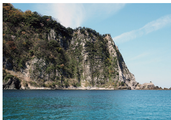
海から見られる山陰海岸ジオパーク①