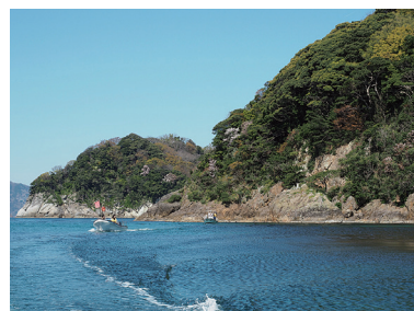
海から見られる山陰海岸ジオパーク②