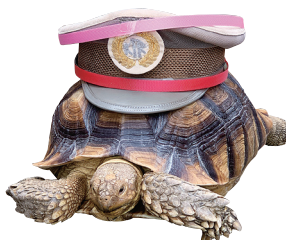
空の駅 駅長 そらちゃん