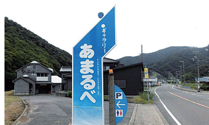
ギャラリー あまるべ