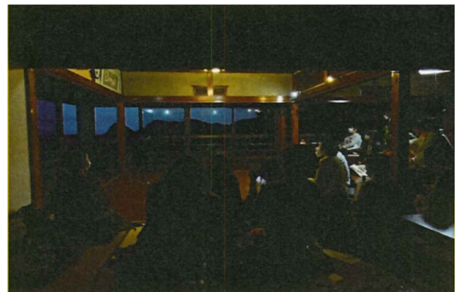
4年10月23日 しんしんしーん at 岡見