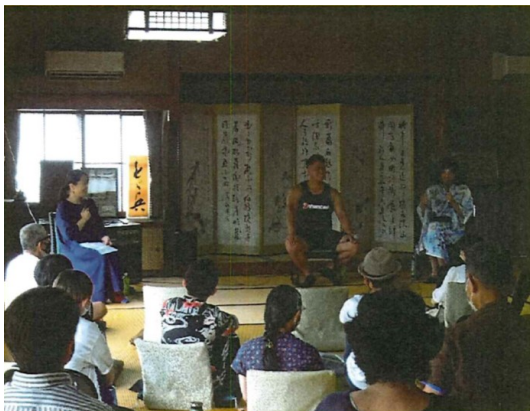
4年6月25日 しんしんしーん at とど兵