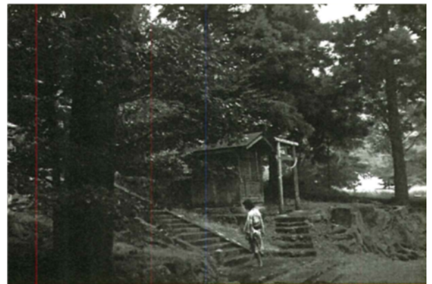
4年8月20日 しんしんしーん at 一宮神社