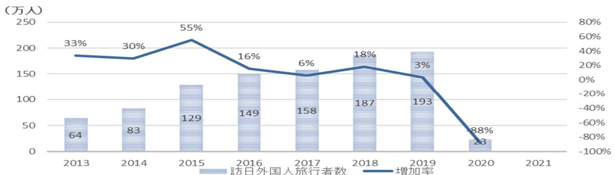
図表 3 【訪日外国人旅行者数の推移 (兵庫県)】