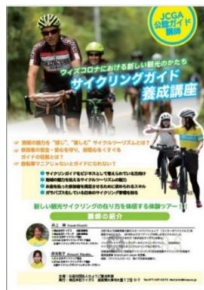
(写真)講座募集のチラシ