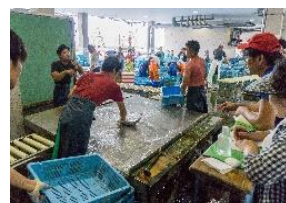
(写真)明石漁港のセリ市