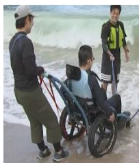
(写真)アウトドア車椅子を用いたモニターツアー

これまでの取組を踏まえ一層の推進を図るため、学識、サービス提供者、利用者等で構成する検討会を開催（R3: 3回）