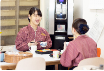
色とりどりのおかずが入ったお弁当に舌鼓。 3食全てまかないでいただくこともできます。