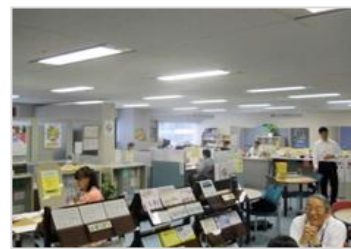
(ひょうご・しごと広場の相談窓口)