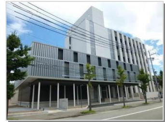
〈工業技術センター研究本館〉