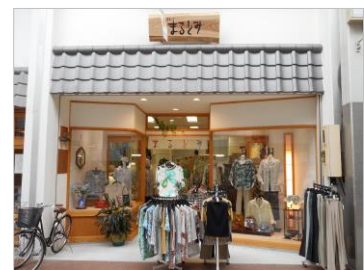
(写真: 商店街個店外観整備)