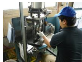
(写真:障害者体験ワークの様子)