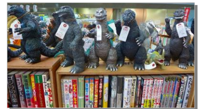
(写真:怪獣ショップの様子)

サブカルチャー関連の店舗開店希望者をターゲットにチャレンジショップ事業を展開。「怪獣ショップ」「怪獣酒場」といった個性的な店の誘致に成功