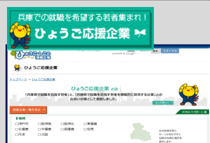
(ウェブサイト「ひょうご応援企業」)

兵庫で就職をめざす若者と、若者を積極的に採用する企業を支援する「ひょうご応援企業」就職支援事業。兵庫県やひょうご・しごと広場のホームページで「ひょうご応援企業」を紹介し、地元企業の魅力を紹介するほか、若者と企業のマッチング機会を設け、兵庫での就職拡大と地元企業の人材確保を図っている。