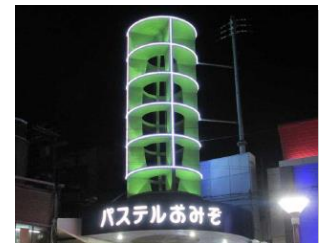
(写真: 商店街共同施設の改修)