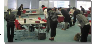
(再就職セミナーの様子)