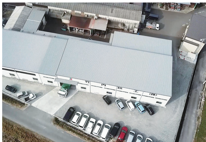
国道175号線横の新工場 (2018年増築)

2020年には新事業を立上げ、地域に貢献できる企業としてものづくりに励んでいます。