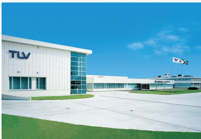
加古川市の本社工場

グローバル企業を目指し、国内に11拠点、海外12カ国にグループ会社、58カ国に108以上の代理店を展開しています。