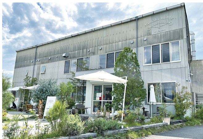
染色工場跡地をリノベーションした拠点「tamaki niime mura」

らできるものづくりは、性別や世代を超えて、取り扱い店舗実績は国内200店舗・海外15カ国に広がっています。社内には農業のチームもあり、素材となる農薬不使用栽培のコットンや自分たちで食べるお米・野菜も手掛けしており、自給自足的・循環型の経営に取り組んでいます。