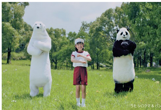
「く〜るぐる」のTVCMでおなじみ!

でにない高効率なサーマルリサイクル施設である「三木バイオマスファクトリー」を保有し、地域にエネルギーを供給するほか、食品リサイクルループを構築する堆肥化施設や、大規模な埋立容量を誇る最終処分場など、さまざまな施設を備えた総合リサイクルセンターです。