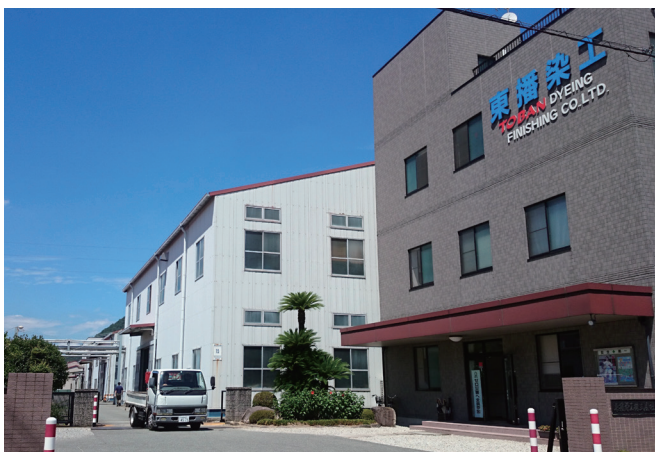
西脇市の上空から見えるオレンジ色の屋根が当社

イルメーカーとして独自の地位を築いており、知る人ぞ知る存在です。当社の作った生地は、セレクトショップの服やコアなファンを有するデザイナーブランド用の上質な素材として幅広く利用されているだけでなく、雑貨やインテリアなどにも販路を広げています。