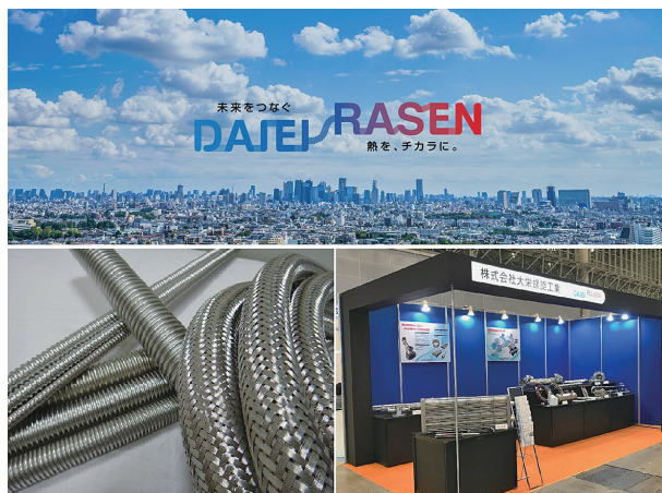
フレキシブルチューブと熱交換器です

に貢献することを目指しています。2022年には、これまでの活動を評価していただき、ひょうご仕事と生活のバランス企業表彰を受賞できました。これからも働きやすい職場を目標に、日々みんなで改善に取り組んでいます。