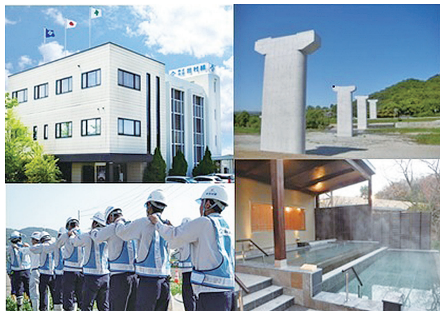
仕事への情熱は 未来の地図に刻まれていく

もひとえに建物に対する情熱と高い技術力で納得のいく建物をお客様に提供し、信頼と安心を築いてきた証であります。これからも私たちの生活に欠かせないインフラを整備する建設業に従事することに誇りを持ち、愚直に邁進していきます。