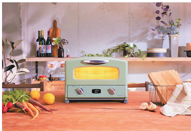
アラジンは当社の自社ブランドです

このような独自の技術力や企業活動が認められ、平成29年度には「ひょうごオンリーワン企業」や「グッドカンパニー大賞」、令和3年には特許庁から「知財功労賞」を受賞させていただきました。