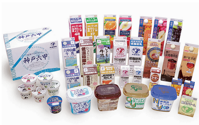
共進牧場でつくっている商品の一部