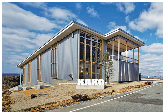
カコテラス（社員の憩いの場）

開業から40年以上経過した小野工場では、2021年5月に機械工場を、2022年2月に板金工場を建設・移設し、部品製造・加工部門がパワーアップしました。さらに、2022年3月には、社員の憩いの場としてカコテラスが完成し、社員のコミュニケーションの向上を図っています。