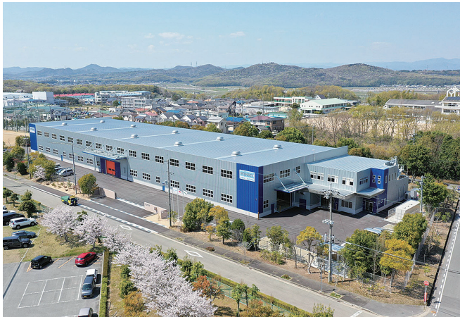
2020年4月に稼働した新工場

当社は、リサイクル機器を造ることで、地球環境保全や循環型社会の実現に貢献しています！