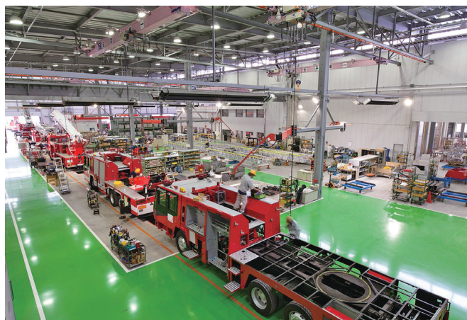
工場内の作業風景です

「安心」を支える技術と絶えざる挑戦で人と地球のいのちを守る、を"パーパス"とし、日々業務に奮闘しております。