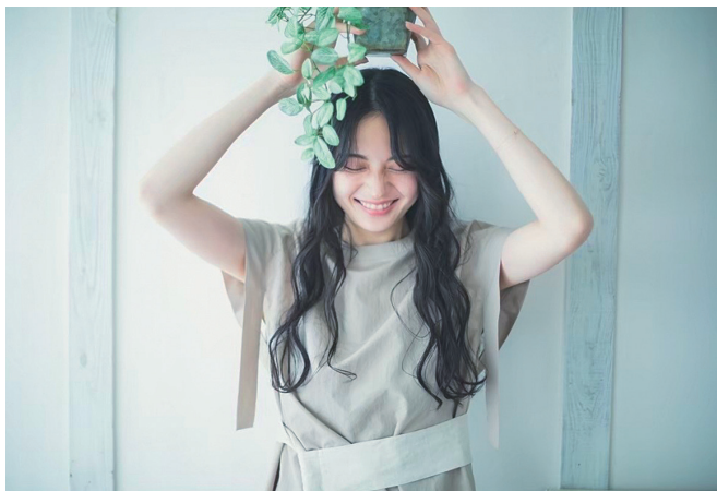
髪・人・地球環境に優しいヘアサロンを目指しています

今だけでなく、5年後10年後のことを考えた最新のメニューや商材を取り入れ、お客様に寄り添い、喜んでいただけるお店づくりをしています。美容院の「枠」すら超え「可能性」を無限に広げませんか？