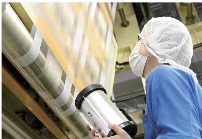
印刷の柄ズレチェックをストロボを使用して

頑張ったら頑張った分を社員に還元したいという想いで決算賞与は全社員一律同額支給。社内には、プレジャーボートで釣りを楽しむ釣り倶楽部やフットサル・野球等スポーツに興じる社員も多数在籍しております。有給消化率87%。待ってます!