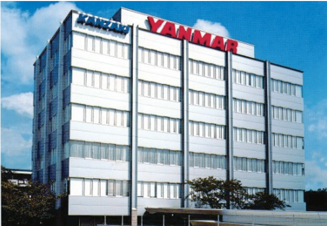
JR猪名寺駅から徒歩5分の場所にある本社ビル

基本的に尼崎本社での勤務となるため、兵庫県で働き続けたい方や生まれ育った土地に恩返しをしたい方にはぴったりの会社です。