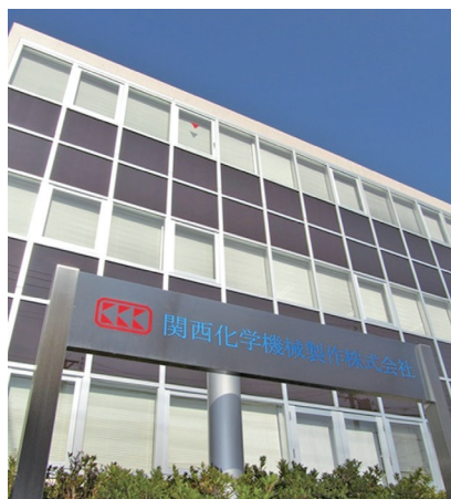
本社管理棟：太陽光発電を壁に施工して省エネ

ニーズにマッチした装置やシステムを多数開発してきました。例として、高性能蒸留塔(リフトトレイやチェンジトレイ)、溶剤回収で高い省エネ効果を発揮するウォールウェッター、WWムートンなどがあります。これらは化学工学会学会賞や分離技術賞、発明大賞、科学技術庁長官表彰などを受賞しています。