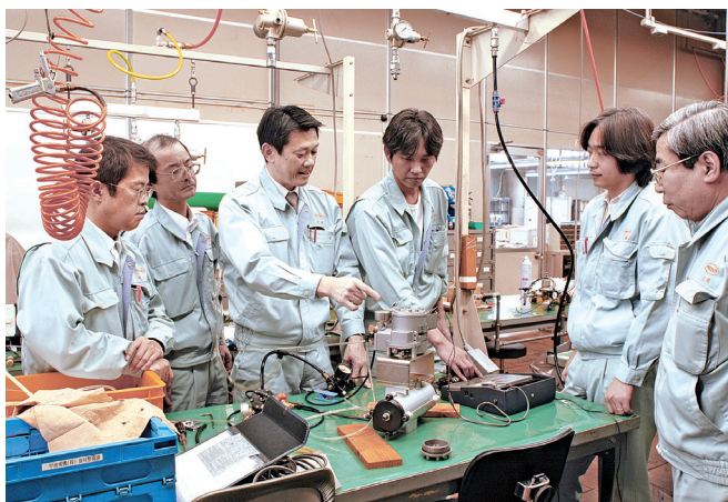
商品開発は、皆で試作品を評価

機械産業など基幹産業をはじめ、あらゆる「ものづくり」現場の発展を支えるとともに、世界の生産プラントや製造設備でその信頼性を実証し続けています。