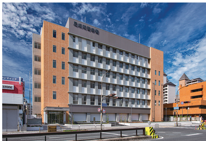
尼崎南警察署も当社で建築させていただきました

これからも「IF」から「TRY」に」のローガンのもと、チャレンジ精神で変革の時代を乗り切っていきます。