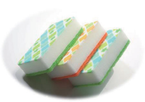
当社の製品と製造機械