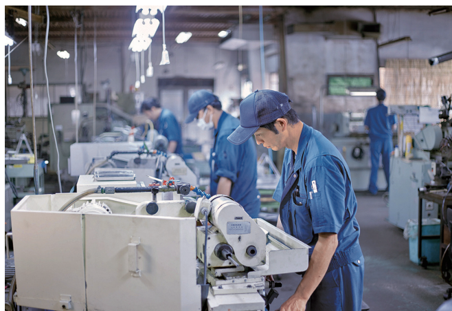
ミクロン単位の作業風景

今までは男性が主に働く場所とされておりましたが、現在は女性も働きやすい環境整備や効率のよい生産方式を取り入れ、女性ならではの多彩なアイデアが生まれることにより新製品の開発が加速しております。