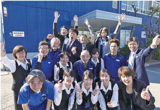
若手からベテランまで、幅広い世代が活躍しています

「西日本の食品物流は尼神運輸へ任せれば安心」「尼神運輸に頼んでよかった」そう言っていただけるよう、これからも まいしん 邁進していきます。