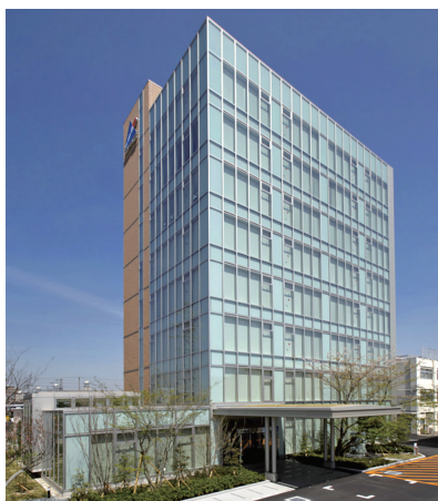
2020年3月で創立65周年を迎えました

創業者から受け継がれている『常に誠実であれ』という言葉をもとに、従業員一同、“時代とともに成長する企業”を目指しております。