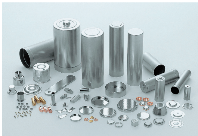
当社が製造している電池外装缶をはじめ、様々な精密部品

また、金型設計・製作から製品の製造・販売まで、自社での一貫対応ができる当社ならではの様々な提案が可能です。