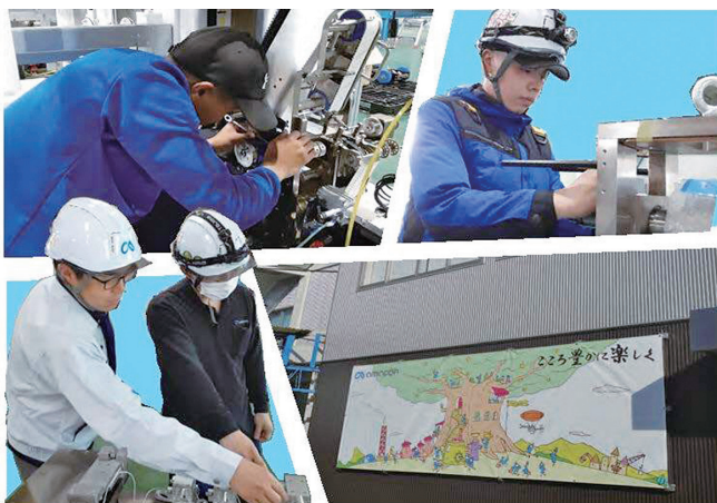
こころ豊かに楽しくをモットーに若手社員が活躍しています！

今後も時代の潮流を掴み、最新の技術力でおお客様のご要望にお応えする総合エンジニアリング企業として邁進してまいります。