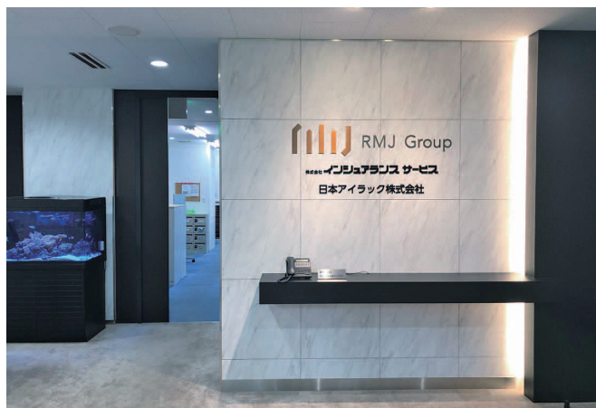
本社エントランス

グループ会社には 危機管理会社やシステム会社があり、ワンストップでサービスを提供することで、他社にはない『保険 + \alpha 』の付加価値の高いコンサルティング活動を実現しています。