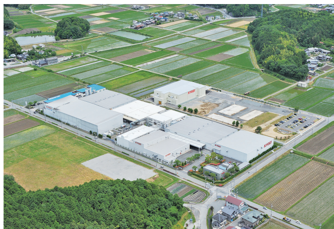
丹波篠山市にある本社工場全景

福井工場とグループ会社の関東共栄（茨城県）で製造する食品包装用のポリプロピレンシートは、全国トップクラスのシェアを有しています。