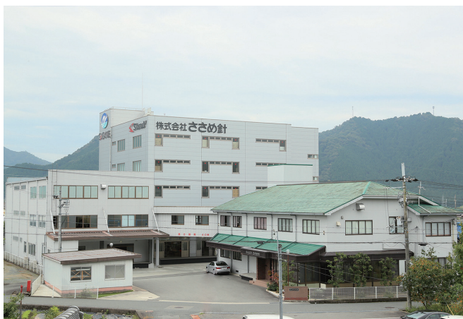
ささめ針本社外観

業界には様々なメーカーがありますが、当社の強みは“遊び心”。 くろつと 玄人をうならせる本格的な針・仕掛けでありながら、初心者やファミリー層にも気軽に手に取っていただけるポップなパッケージやネーミングで幅広いファンを つか 挿んでいます。