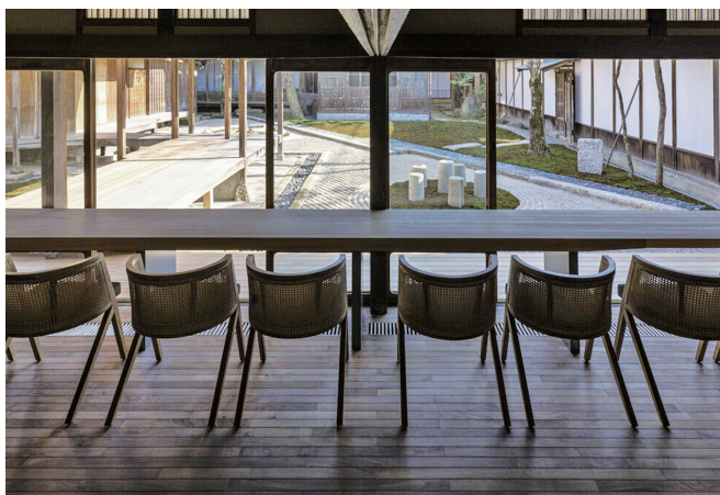
280余年続く伝統の味

として、また建物に芸術的な価値が加わったことにより「庭を見たい」、「空間を体感したい」などのきっかけで来られた方にも黒豆や丹波篠山のファンになっていただけるよう、「お取引先様や従業員又この地域にとって無くてはならない会社であり続けたい」をモットーに地域社会に貢献できればと日々努力しています。