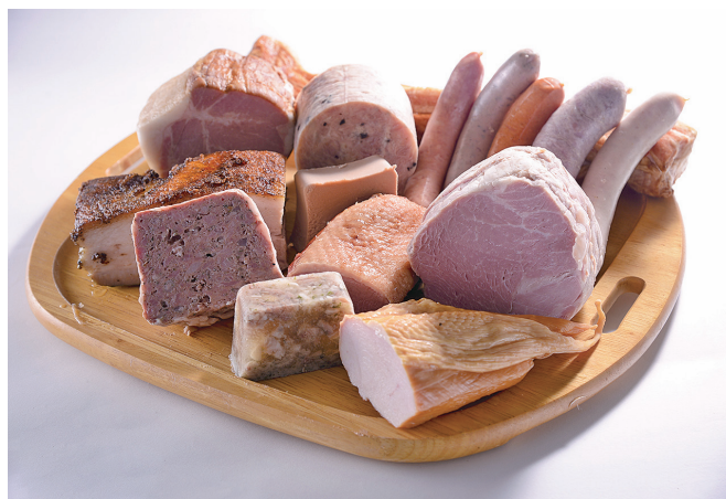
スタッフ一同で丁寧に製造した、バラエティ豊かな商品各種です

また、お客様からの依頼に応じた製品（OEM・委託製造）も手掛けているため、安定した業績も特長のひとつです。