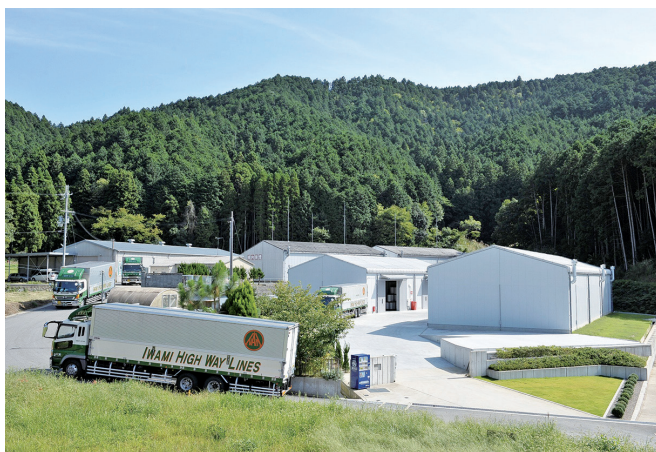
丹波市絹山にある倉庫事業所と配送車両です

丹波市内の化学工場の製品を安全でスピーディーに、そして環境にもやさしい配送を行うための物流システムを独自に構築し、丹波市の企業発展を足元から支えています。