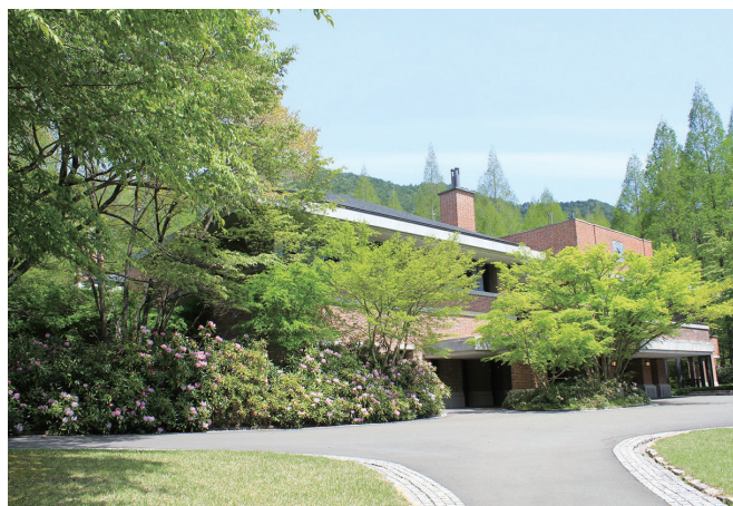
ゴルフファーにとって最高の環境を提供します

2022年には全国2,200程あるゴルフ場の うち、プレーしてよかったゴルフ場・4位に 選ばれました。有名人も多く全国からご来場 されます。選び抜かれたお客様に記憶に残る おもてなしをぜひ一緒に。