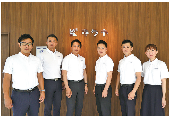
キクヤ 葬祭部 ネムール

丹波エリアに根付き誠実な姿勢で地域社会に貢 献することをモットーに業務に取り組んでいます。