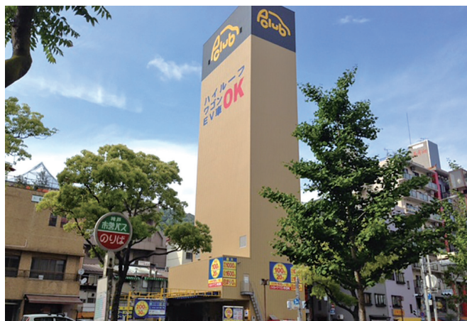
三宮にそびえる弊社のランドマーク「P-CLUB中山手通り」

人口減少化のなか、「現状維持は衰退である」という共通理解のもと、平均年齢29歳の若い社員たちが仕事を通してお客様と感動を共有し、地域社会にとって必要な会社となるため日々の事業活動を行っております。