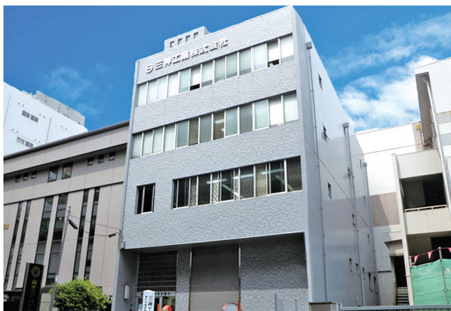
神戸三宮の中心街にある当社本社

今後もお客様をはじめ、地域社会の様々なニーズに合った最適な設備空間を提供し、地元の活性化に少しでも寄与できるよう、若い力を積極的に取り入れ、ますます精進してまいりたいと考えております。