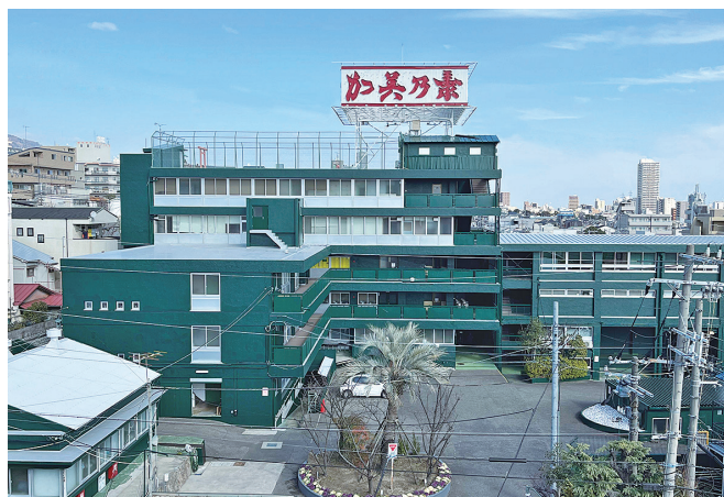
神戸市中央区にある本社工場

今後は、長年培った技術力を生かし、ヘアケア商品にとどまらず、女性用の商品やスキンケア商品など、様々な分野にも積極的に挑戦し、100年ブランド企業を構築すべく、若手社員を中心に、全社一丸となって取り組んでまいります。