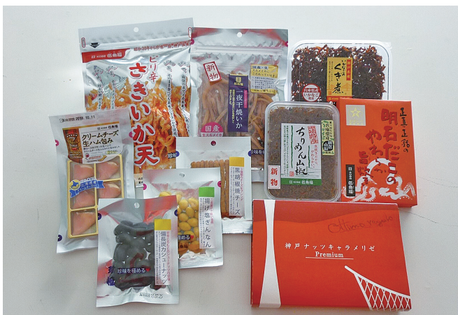
スローガンは「珍味を極める」

大阪・梅田の阪神百貨店に直営店があるほか、最近はネット販売にも力を入れています。「珍味を極める」を商品開発のスローガンにかかげ、全従業員が新商品のアイデアを出す制度などを通し、「すばらしくおいしい」ものづくりをめざしています。