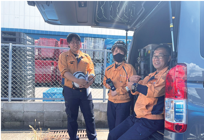
女性社員大活躍中！現場は楽しくにぎやかです

また、従業員満足度向上にも力を注ぐ当社は社員の健康・安全を第一に考え、長く安心して働ける環境づくりに真摯に取り組んでいます。少人数だからこそ一人ひとりが個性を活かして活躍でき、主役として力を発揮できる会社です。