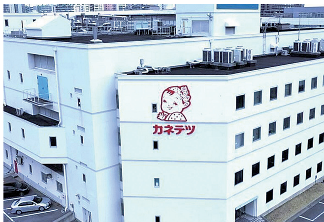
六甲アイランド内にある本社

様々な目標や夢を持った社員がいる当社は、能力の向上だけでなく、仕事を通して人としても成長できる場所です。ぜひ一緒にカネテツの未来をつくっていきませんか？