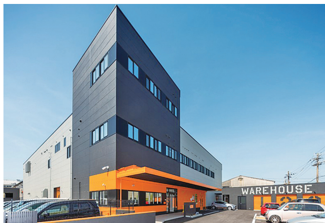
金属加工の駆け込み寺でデジタルものづくり

長きにわたり自動車、航空機、半導体の部品加工の経験もあり、新素材の加工工法の開発もしています。近年では、デジタルものづくりとしてリバースエンジニアリング、従来の機械加工に金属造形加工を駆使した加工も手掛けております。