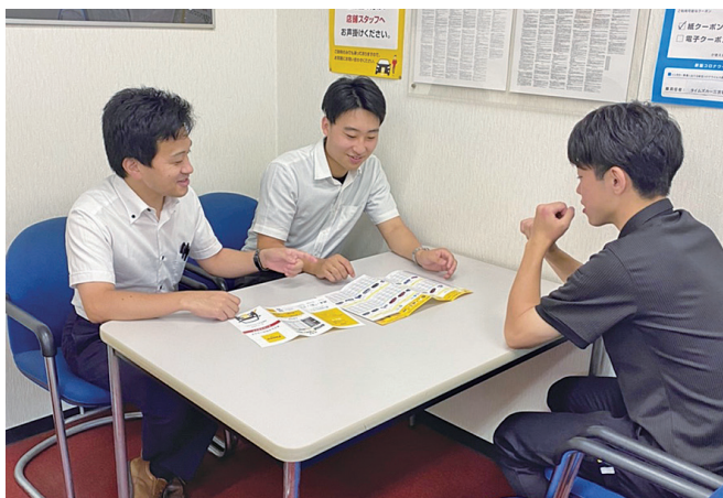
レンタカー事業Timescar店舗です

それを実現するための主役となる「人的資本」すなわち社員の健康においては特に力をいれており、自動車ディーラーでは数少ない健康経営優良法人ホワイト500に2018年より5年連続で認定されています。