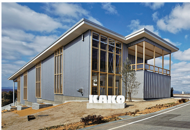
カコテラス（社員の憩いの場）

また、小野工場は開業以来40年以上経過し、老朽化対策として、機械工場を2021年5月、板金工場を22年2月に建設・移設しました。さらに22年3月に社員の憩いの場としてカコテラスを建設し、利便性アップと社員コミュニケーションの向上を図ります。