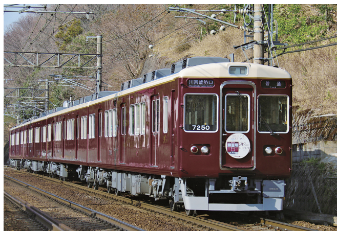
平野駅～一の鳥居駅間を走行する7200系車両

従業員の健康づくりに取り組み、経済産業省「健康経営優良法人認定制度」において、「健康経営優良法人2022（中小規模法人部門）」に認定されました。