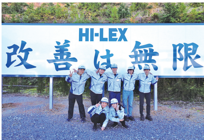
この仕事を通じて社会に貢献できる立派な人を

今後の事業は、次世代の車にも使っていただけの電気・電子部品と一緒にになった製品や、できるだけ人に負担をかけない痛みの少ない医療機器製品を世界に発信していくことに力を入れています。