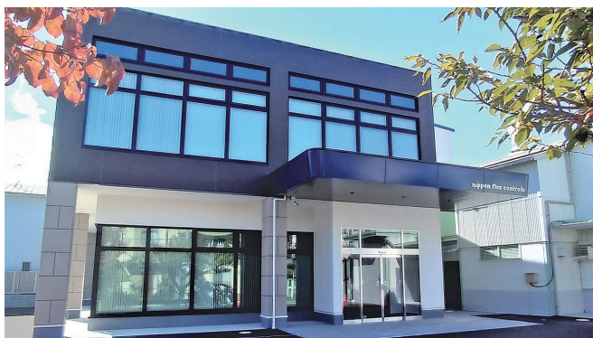
<本社・伊丹工場>JR伊丹駅から徒歩7分です

どの分野で重要な機能部品として利用されています。そして「吾々は、フレキシブルケーブルの新たな付加価値を創造し、そのマーケットの第一人者となる」の経営理念のもと、医療・福祉機器や事務機器、鉄道といった新たな分野へ挑戦することで、コントロールケーブルが持つ無限の可能性を広げていきます。