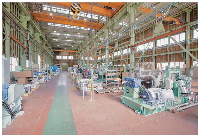
本社工場で機械を組み立てる様子

を展開しています。2020年5月には、新たにドイツの機械メーカーであるライフェルト社をグループ企業に加えたほか、2021年には新工場が完成し、さらなるグローバル化、事業拡大を進めています。