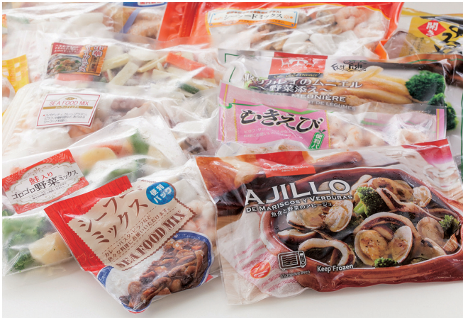
シーフードを主に扱う冷凍食品メーカーです

また、『皆様に必要とされる企業』を目指し、地域社会の一員としてスポーツチームの公式スポンサーなど、社会貢献活動にも積極的に取り組んでいます。これからも、簡単・便利でおいしい冷凍食品で皆様の食卓に笑顔をお届けいたします。