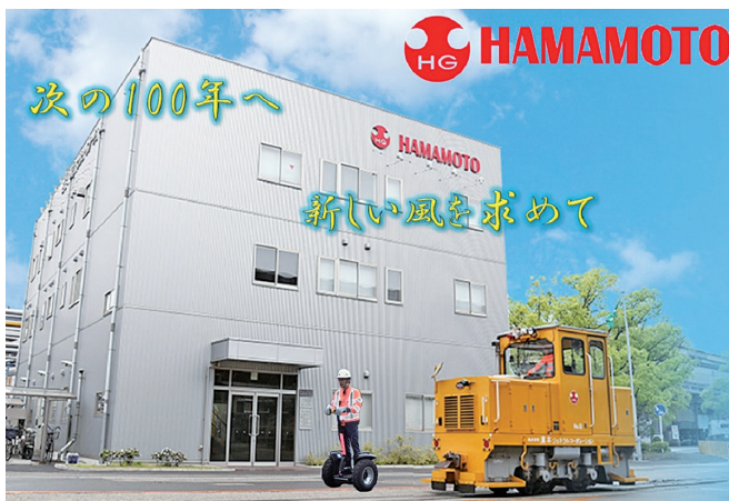
次の100年に向け既に踏み出しています

<事業内容>▽生産部門・・・金属加工、検査、梱包▽物流部門・・・構内運搬、構外輸送、出荷▽建設部門・・・土木工事、工場建屋補修、設備メンテナンス