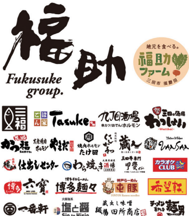
福助グループの店舗ロゴ