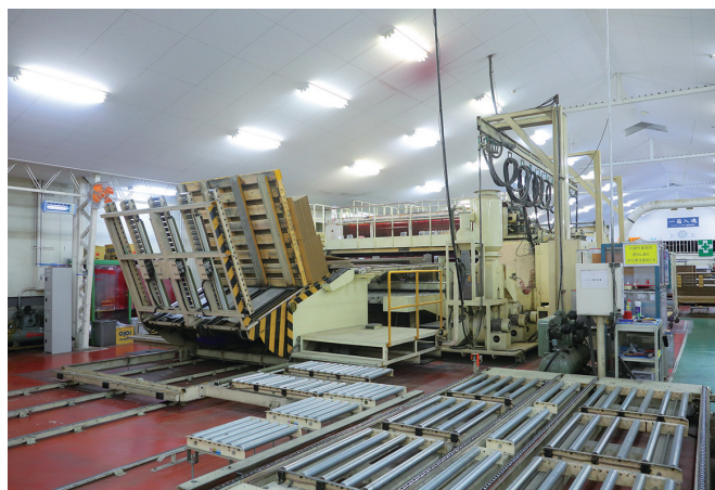
日本最大級の特種大型印刷機が活躍！

近年は、“ハコ作り”のノウハウを物流にも活かし、『“ハコ”から“ハコブ”を変える』をモットーに製造から出荷まで一貫した物流サービスをお客様に提供しています。