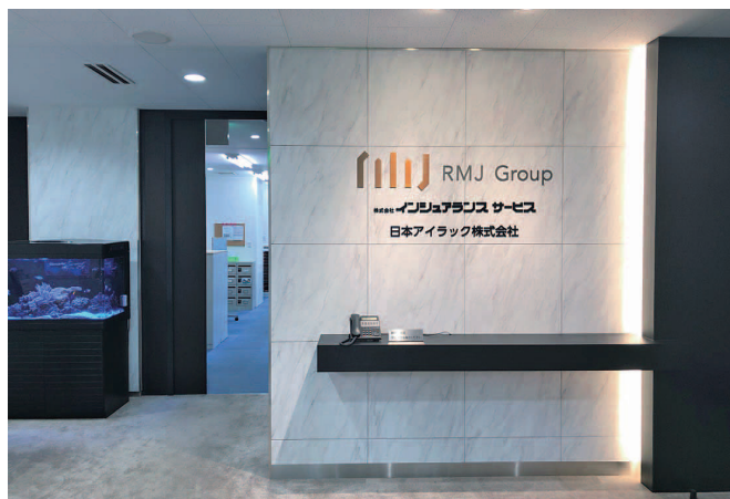
本社エントランス

グループ会社には 危機管理会社やシステム会社があり、ワンストップでサービスを提供することで、他社にはない『保険 + \alpha 』の付加価値の高いコンサルティング活動を実現しています。