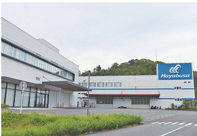
新本社（手前）ライフスタイル物流センター（奥）

現在では北米・中国・ベトナム・ミャンマーと海外進出を図り、釣り事業だけでなくアパレル事業・ペット事業の3本柱で最高の品質・最高のシーンをお客様にご提供できるよう日々挑戦を続けております。