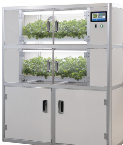
船上で新鮮な野菜が育てられる船用水耕栽培装置

当社は完全週休2日制・休日日数125日を採用しており、男性育児休暇取得奨励など、働きやすい環境作りにも取り組んでいます。6年後に迎える創業100周年、その先の未来へ向けて、船舶の分野にとどまることなく、兵神は挑戦を続けます。