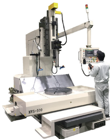
約10tのスロッターマシンNVS-500です

わが社では、最新鋭の機械を用いて高精度な部品加工を行う加工課、常に探求心をもって機械を組み立てる組立課、社外の協力会社やお客様と密に連絡を取り仕事をこなす業務課の3つの課が上手に作用して、お客様に満足してもらう商品を製造しています。