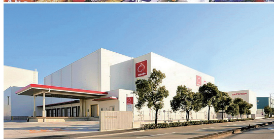
加古川工場の製品と外観写真です