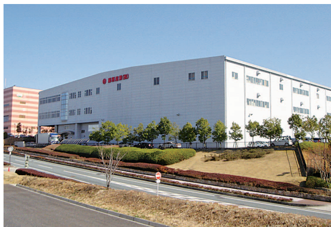
小野市にある、当社の物流センターです！

ランドの商品開発も行い、企画開発型商社としても高い評価を得ています。今後も、創業から100年以上続く歴史と信頼を守るため、変革とチャレンジを続け、業界のリーディングカンパニーとしてさらなる成長を目指します。