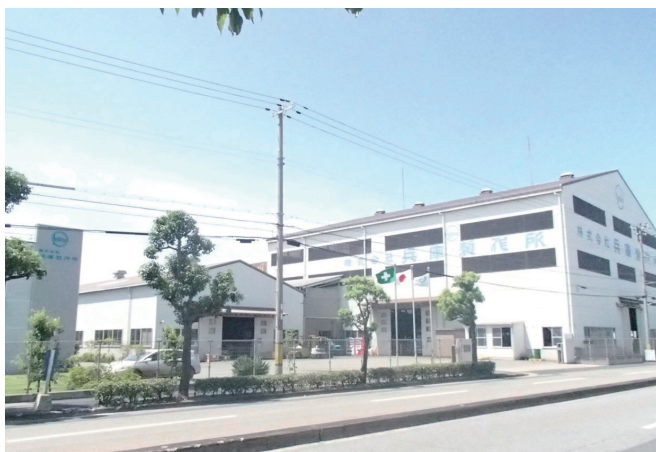
加古川市の本社工場

また、試験片加工部門では鋼材の研究開発試作に関わるあらゆる相談を承るほか、完全自動加工ラインによる試験片加工の24時間操業を実現するなど、お客様より高い評価を得ています。