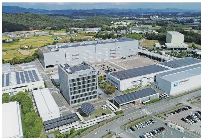
関西本社 加西工場

企業の急成長が見込まれるだけに、採用の拡大を積極的に行っており、人を中心とした経営についてはトヨタやパナソニックの精神を受け継ぎ、『ものづくりは人づくり。ものをつくる前に人をつくる。』の考えのもとに人材育成にも積極的に取り組んでいます。