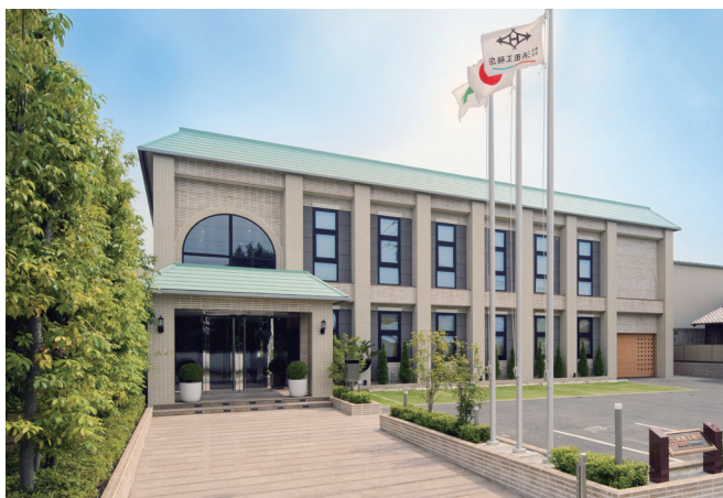
高砂市の発展と共に成長している当社

会社が一つのチームとして機能し続けるために、従業員同士がコミュニケーションを図る機会、社員が成長できる機会が多く、一人ひとりが自律した主体的な人間に成長できる社風が魅力です。地元兵庫でものづくりを通して社会に貢献し、仕事のやりがいを一緒に実感しませんか？これからの浜田工務店を私たちとつっていきましょう！