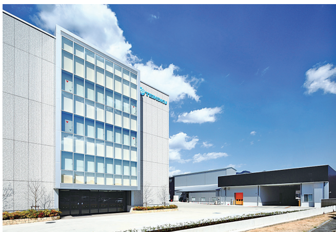
世界各地に向けてポンプを製造している本社工場の外観です