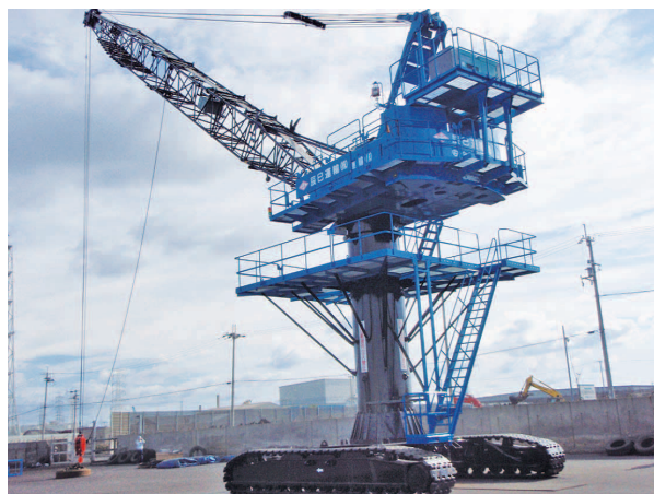
ハイボストクレーン (コベルコBM1000HP100t)

また、ますます多様化、高度化する物流業界において“より安全”“より確実”“より迅速”をモットーに、地域社会、お客様、従業員とその家族との絆を一段と強め、信頼され愛される企業づくりを目指していきます。