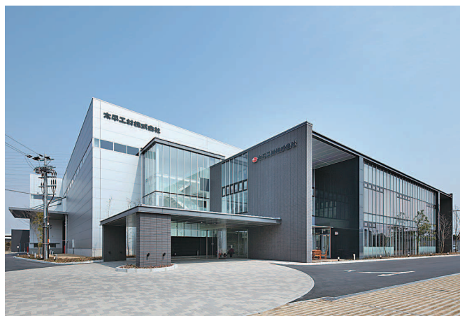
2017年に竣工した新社屋

当社の事業は「人」の力に頼る部分が多いのが特徴です。全員が力を合わせて、楽しく働くことで、会社の業績も上がり、社員の満足度も高まります。実際に当社に来ていただければ、わかりますが、社内にはいつもなごやかな雰囲気。笑顔が絶えることはありません。