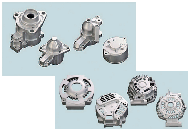
ガソリンエンジンのスタータとオルタネータ（発電機）

べると自動車関連の産業は多くないですが、自動車産業は日本経済をけん引していく産業で、今後も電動化、自動運転と技術革新が進むと思われます。2020年3月には広畑に3つ目の工場を稼働させ、電動化部品に対応した生産を行っています。