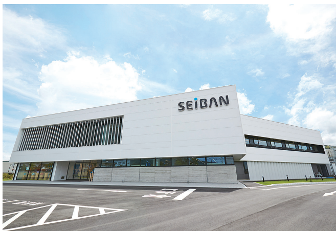
2019年に建設したばかりのきれいな本社工場には食堂も完備しています

私たちセイバンは愛情を込めたものづくりを通じて、お子さまとご家族の笑顔にあふれた生活に貢献していきます。