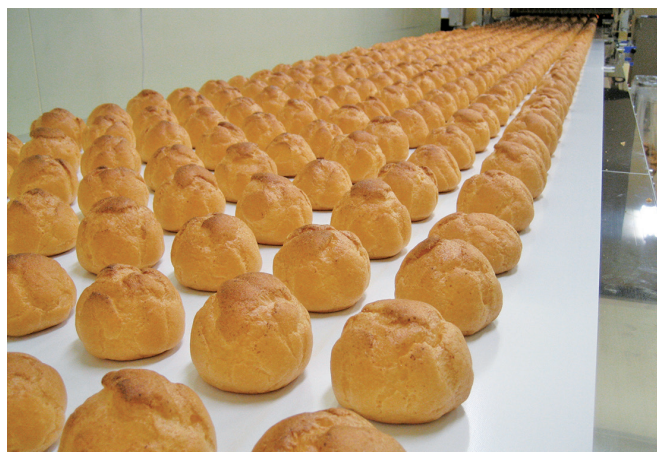
シュークリーム製造ライン

お客様にお届けすることができる工場になりました。デザート工場は「オレンジ」ブランドでシュークリーム等の洋生菓子を全国展開で販売し、今では海外にも販売網を広げております。煎餅工場は兵庫県（海鮮せんべい但馬）と和歌山県（海鮮せんべい南紀）にて工場で製造している風景を見ながら商品を購入できる工場売店になっております。