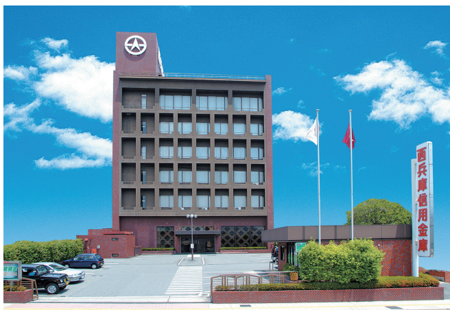
宍粟市山崎町にある本店建物

また、健全・堅実をモットーとした経営のもと、安定した業績を築いています。仕事の内容は、預金業務・融資業務・為替業務や公共料金等の受け入れが主な業務になります。これに加えて、保険や投資信託などの預かり資産も取り扱っています。