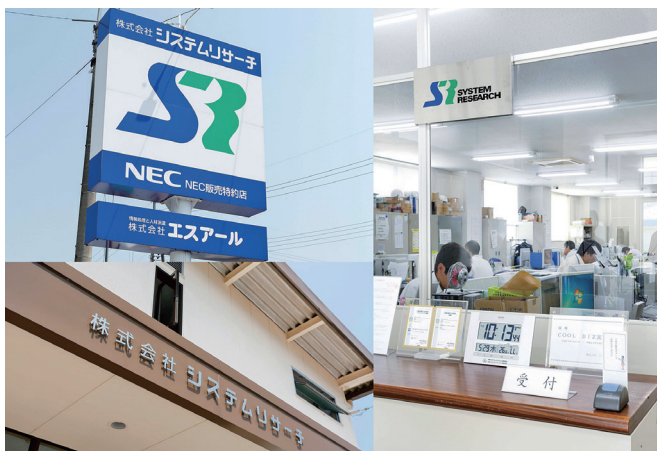
本社社屋 (看板・受付)

また、社員が誇りを持って仕事に取り組むことができる環境づくり、お客様とシステムリサーチを大切に、心のもった仕事ができる人材があふれている…そんな会社づくりを大切にしています。