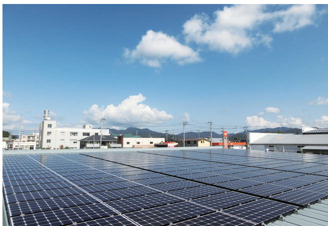
人が「働く」環境において、様々な分野の改善をサポート!

陽光発電」の経験と強みを活かした、地域のエネルギーソリューション企業も目指し、地元企業さまの職場の、温熱・快適環境づくりへの提案にも注力しています。これからも、様々な方・組織とのつながりに感謝し、五方良し（地球・地域・社員・買い手・売り手）を大切に未来をつくり続けていきます。