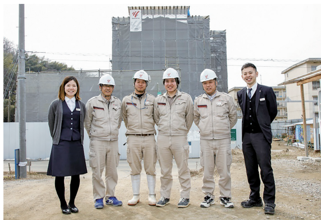
若手とベテランが一緒に活躍できる会社です

土木と建築の総合力で様々なプロジェクトを手掛けることで、地域の発展とそこで暮らす皆さまの安全と安心を守る地域防災の担い手として今後も活躍してまいりたいと考えております。