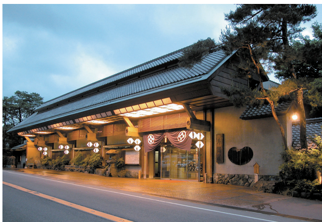
佳泉郷 井づつや 玄関

お客様の感動と喜びを自分の喜びと感じられる方、自然豊かな環境の中で私たちと一緒にチャレンジしてみませんか。