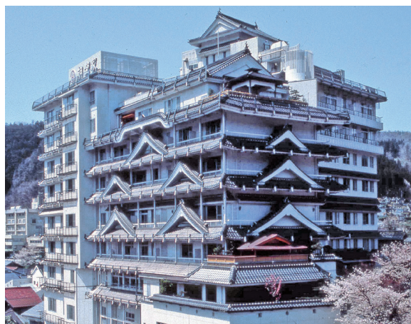
湯村温泉にそびえ立つお城造りの朝野家