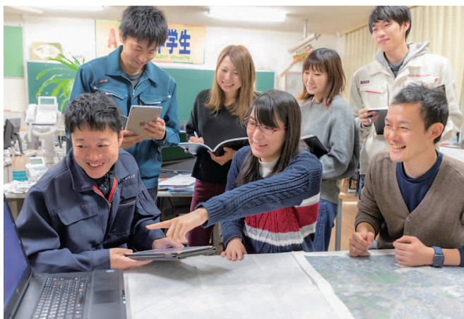
ミーティング風景