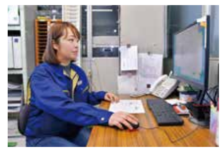
毎朝、数十通に及ぶ発注のメールをチェックします。

市内には自然の遊び場が多く、病児保育施設もあるので子育てと仕事の両立がしやすいと語ります。「充実した毎日を過ごせています。やっぱり地元はいいですよ」と晴れやかな表情を浮かべます。