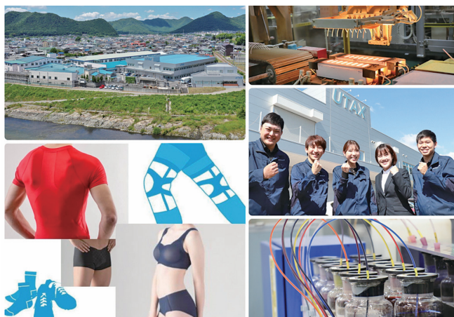
2018年に新厚生棟を増築。2017年地域未来牽引企業に選定

また、世界にもいち早く目を向け、現在海外に4つの生産拠点、5つの販売拠点を設けて事業フィールドを広げています。当社には皆さんの力を発揮できる多様なフィールドがあります。より良いものづくりを目指し、自己の可能性を広げてください。