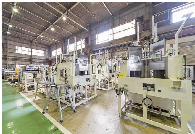
国内外へ洗浄機を送り出している明石本社です

えています。実は！世の中で走っている車の多くは、弊社の洗浄機を使用して生産された部品を使用しています！また仕事以外においては、社内イベントや社員旅行などを定期的に行い、社員同士のつながりを大切にしています。「仕事」も「遊び」も全力で取り組んでいる会社です！