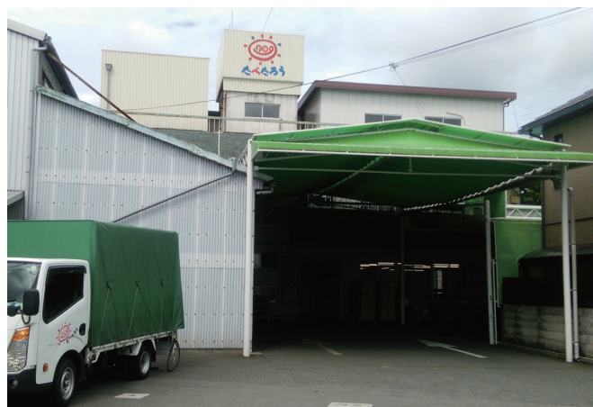
正面玄関 たべたろうが企業のロゴマーク

従業員の年齢も10代～60代と幅広く、女性が7割以上を占め多く活躍されています。企業精神は「共生」で、お客様に安全・安心の食品をお届けし、おいしいなあと笑顔になっていただけたらと願いを込めて、「広がりおいしい笑顔」が弊社の企業スローガンになっています。