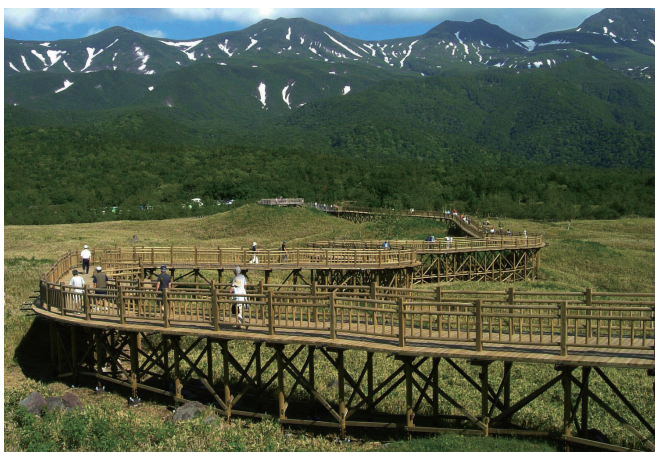
当社施工実績 知床五湖遊歩道（北海道）