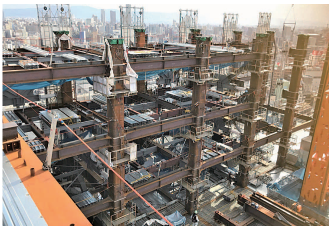
あなたの街のあちこちで、いい仕事しています

創業から47年、身の丈経営を信条とし、ゆっくりと、しかし着実に業績を伸ばし、規模を広げてきました。独自のブランド力を持ち、地域や社会、世の中の屋台骨を支える企業をめざしています。