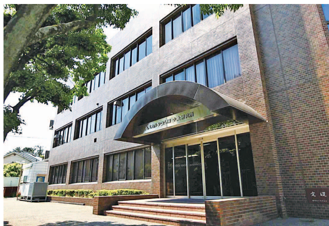
炭酸カルシウムの総合研究拠点「中央研究所」

石を原料とする炭酸カルシウムは安全で環境にやさしく、今後さらなる用途の広がりが期待できる素材です。あらゆる可能性を秘めた炭酸カルシウムという素材の機能を最大限に引き出し、人と社会に豊かさと快適さを提供し続けていきたいと考えています。