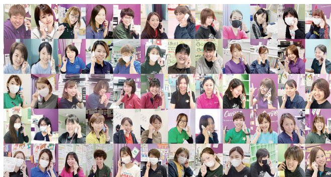
モリスは女性に健康と笑顔をお届けしています！