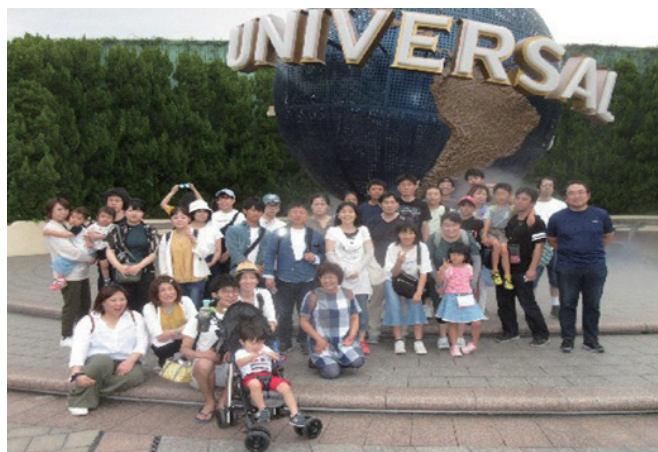
2019年7月社員旅行でUSJへ行く

また、グループ対抗運動会、社員旅行、ボウリング大会等社内行事（自由参加です）も盛んで楽しく活気のある職場です。