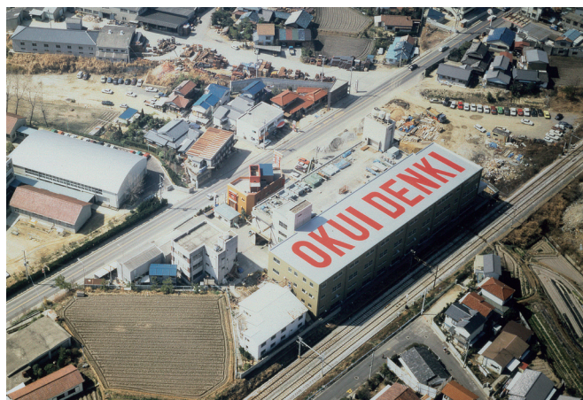
明石市大久保町の「明石工場」