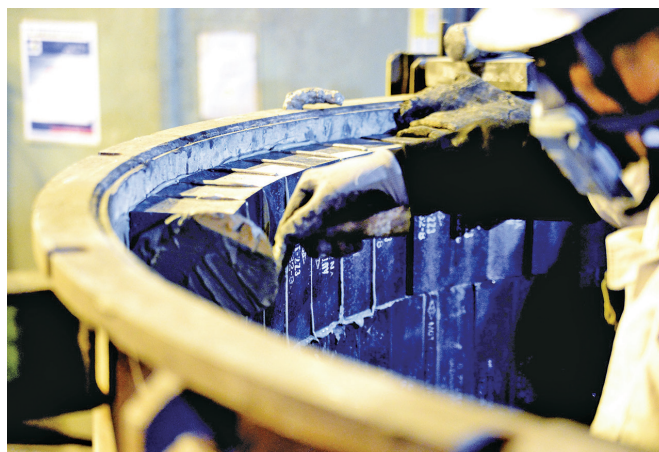
いまだに機械化できない貴重な技術職「築炉工」

う貴重な専門技術職です。変化のスピードの早い現在には、自らの失敗を認める勇気を持つことが明日への成功の近道と考え、「失敗を認める勇気を持とう」というスローガンを全社的に掲げ、「モノづくり」は「人づくり」、伝統と技術を受け継ぐ人材育成に力を入れています。