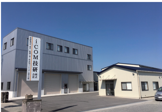
ロボットセンター 新サービスの拠点として新設

当社は制御盤事業（設計・製作・施工）や、板金事業（切断・曲げ・溶接）も展開しており、各事業の特色を活かして相乗効果を発揮し、今後も事業の拡大を目指していきます。