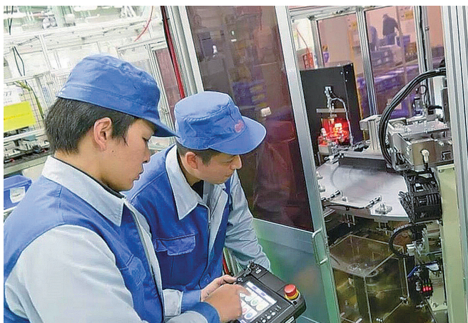
自社独自の技術開発

加工から熱処理、組立、性能検査まで全工程を社内でする一貫生産が当社の強みです。最新鋭の機械設備と長年のノウハウで多品種少量生産により様々なお客様のニーズにお応えしております。AIロボットと人間との協働に挑戦し続けます。