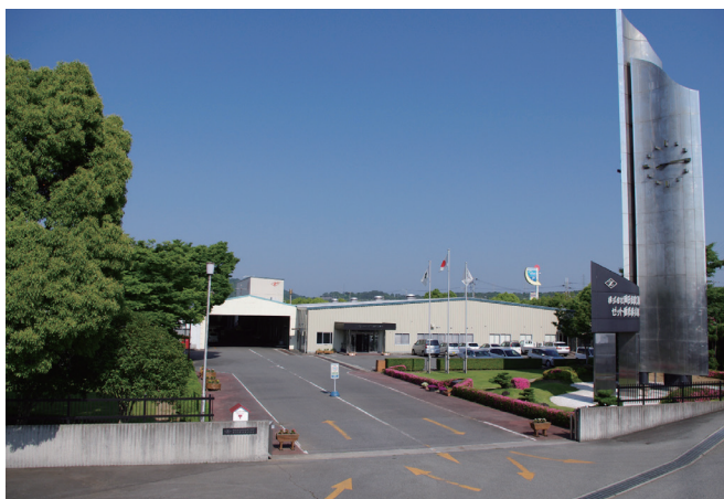
会社正門から。右側のゼットタワーは平成2年に完成

スタンダード製品となりました。さらなる成長のため、新製品開発は国内向けのみならず、海外のお客様のニーズを取り込んだ海外向け製品の開発にも注力しています。生産設備のほとんどを社内で設計・製作することで、国内外のニーズに迅速にきめ細かく対応し、お客様に満足いただける製品づくりを目指しています。