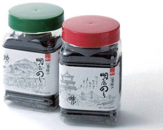
鍵庄の主力商品「明石の恵み」（味・焼）です

どちらかという和気あいあいとした社風で、年に1度の旅行や新年会はパートナー（鍵庄ではパートさんをこう呼んでいます）さんと一緒に楽しんでいます。