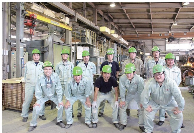
神崎サマタ工場集合写真

ワークライフバランスもきっちり確保できますので、仕事の後に皆さんそれぞれの好きなことができるということも魅力的な会社です。