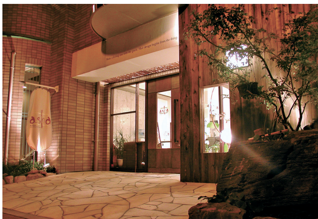
サロンごとにテーマを変えて出店しています

のお客様に喜んでいただけるお店づくりをしています。店舗は神戸本山に2号店をオープンし、2016年に沖縄石垣島に3号店をオープンいたしました。理美容業界の革命を起こす存在でありたいと常に考え、新しいことへのチャレンジスピリッツを大切にしております。