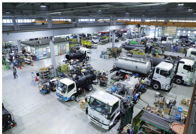
オーダーメイドに対応する高効率な生産ライン

これからも私たちモリタエコノスは、衛生車・塵芥車・特装車・訪問入浴車など様々な分野で地球環境保全と、安全で美しい社会づくりに取り組みます。