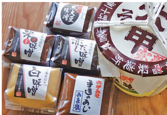
芦屋で味噌を造っています

や酵母などが生成され、それらが複合的に働いて健康効果の高い味噌になります。「バランスのよい食生活が、健康な心と体、そして『生きる力』を身に付ける源になります。ぜひ味噌汁を健康づくりに役立ててほしい」と学校や幼稚園での食育活動ほか、味噌づくり教室や味噌講座を展開し「味噌」についての説明を積極的に行っています。