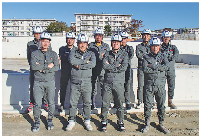
工事現場で作業員全員で撮った写真です