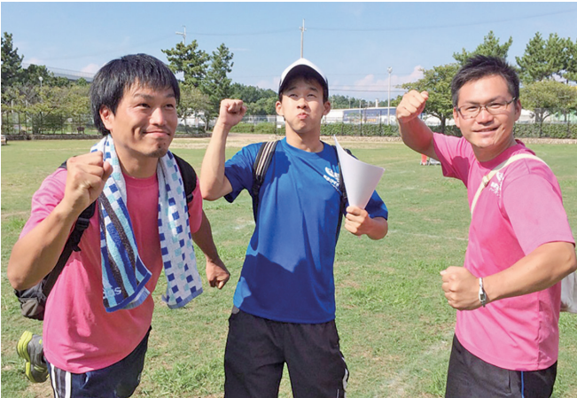
社外運動会に参加した社員

が同額一律支給されます。ここ2年は連続して10万円支給となりました。全社員で幸福を追究しており、社内には釣り倶楽部もあり、会社所有のプレジャーボートでの釣りやクルージング、フットサル・野球等スポーツに興じる社員も多数在籍。社員同士の親睦を深め、大家族経営で幸福を皆でつかみましよう。