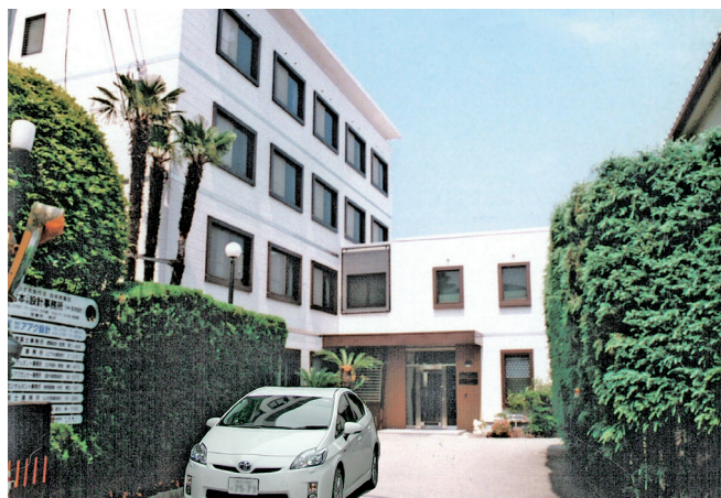
環境と調和の新空間を創造する技術者集団

で官公庁・民間等多方面の方々にご愛顧いただき感謝しております。また、阪神・淡路大震災に際し、被災地内にある当事務所半世紀の作品(大型物件約1000件)においては、ほとんど被害はありませんでした。CAD(約50ライン)のパイオニア(3次元)AIに向かって努力中です。最近の代表作品：新名神高速道路宝塚北SA・大阪高等学校