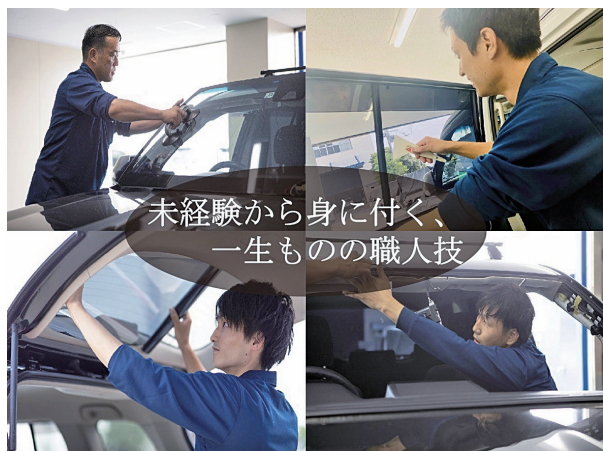
自分の技術が力になる! ガラス作業のプロ!

10年、20年、30年と自動車業界で未永く生き抜いていける力を当社で身に付けてください。