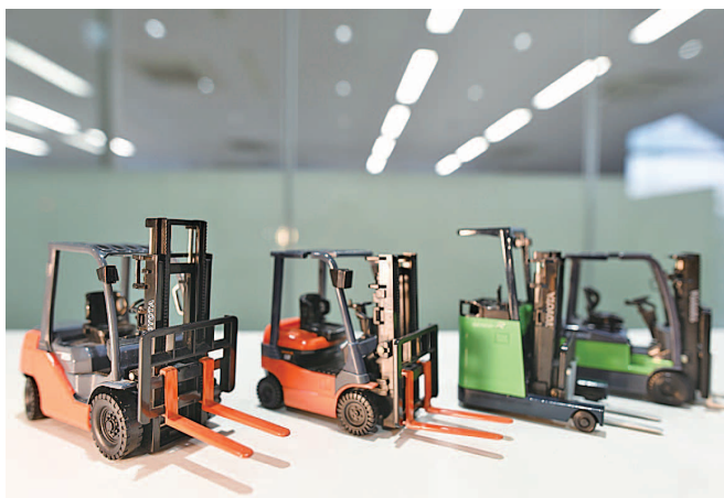
お客様の物流の未来をともに創る

一人ひとりが持つ最大の力を発揮できる、企業の環境・風土づくりも大きな使命と考え推進しております。私たちはお客様に喜んでいただくことが当社の発展にもつながるという考えのもと、日々活動しております。