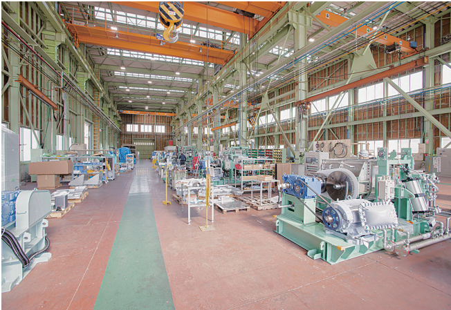
本社工場で機械を組み立てる様子

球環境保全に貢献する「環境事業」を展開しています。2020年5月には、新たにドイツの機械メーカーであるライフルト社をグループ企業に加え、さらなるグローバル化、事業拡大を進めています。