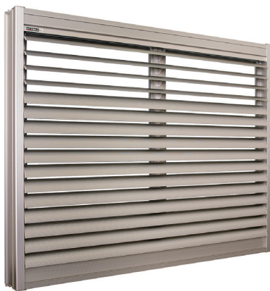
全国のマンションに取り付けられている当社製品

さらなる50年に向け「Try to Challenge」をスローガンに新しい事業領域に挑戦していきます。