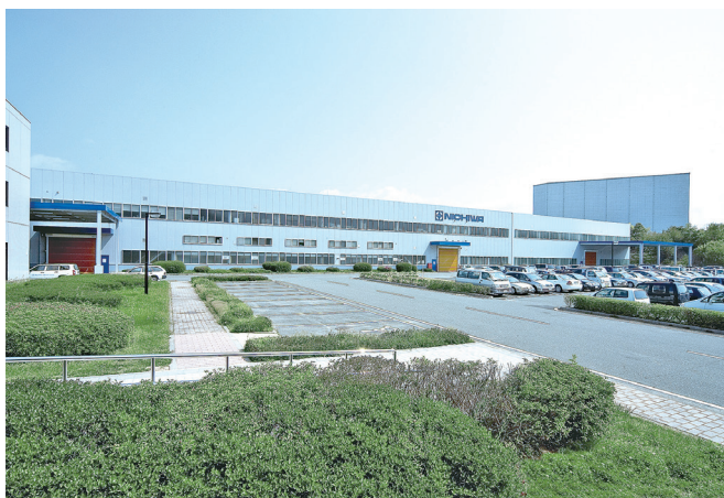
兵庫本社および本社工場の外観

製品のデザイン・寸法から小さなパーツに至るまで、全て自社で設計開発しています。こうしたこだわりがお客様に評価され、業務用電気厨房機器ブランドにおいて、トップクラスのシェアを誇るまでになりました。