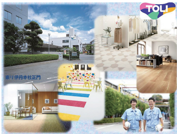
カーペットや壁紙、カーテンなどの内装材メーカー

オフィスにも、大型ショッピングセンターにも、空港にも、そしてみなさんの学校にも…。普段何気なく過ごしている空間に東リの製品はあふれています。