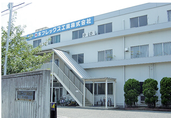
<本社・伊丹工場>JR伊丹駅から徒歩7分です

どの分野で重要な機能部品として利用されています。そして「吾々は、フレキシブルケーブルの新たな付加価値を創造し、そのマーケットの第一人者となる」の経営理念のもと、医療・福祉機器や事務機器、鉄道といった新たな分野へ挑戦することで、コントロールケーブルが持つ無限の可能性を広げていきます。