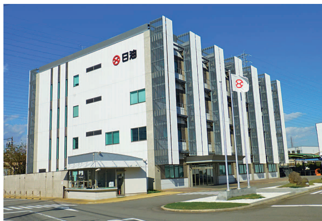
工場と研究所（2011年竣工）が隣接

油化事業では、シャンプーや化粧品といったトイレタリー製品、電子部品などの素材を世に送り出しています。DDS事業では、医薬品を体内の必要な場所に必要な量を必要な時間だけ作用させ、効果を最大限に高める技術、DDS（ドラッグ・デリバリー・システム）関連の製品を展開しています。