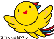
兵庫県マスコットはぼたん